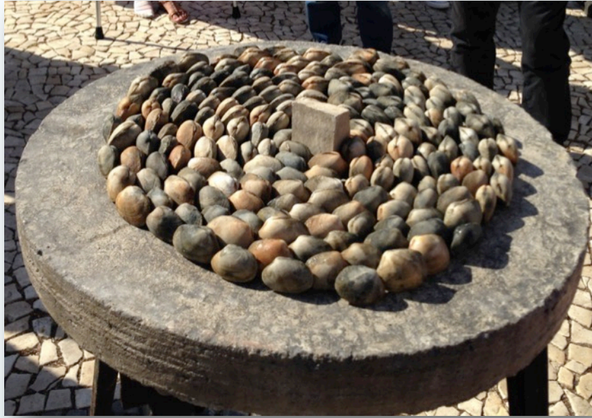
Vila de Amêijoas