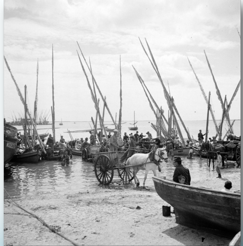
Fotografias de Artur Pastor: Lagos e Olhão, anos 50 a 60