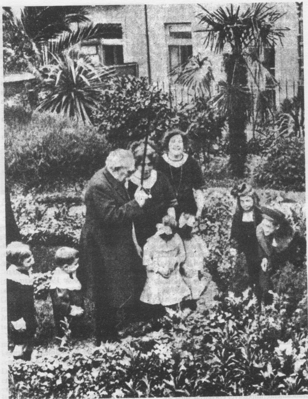
Manuel de Arriaga, um dos patriarcas do regime republicano, implantado em Portugal em 1910, fornece, na sua faceta da vida familiar, mais do que uma vez pretexto a reportagens

Europa e do mundo inteiro a imagem de um povo que se batia em defesa da liberdade alcançada com a implantação do novo regime