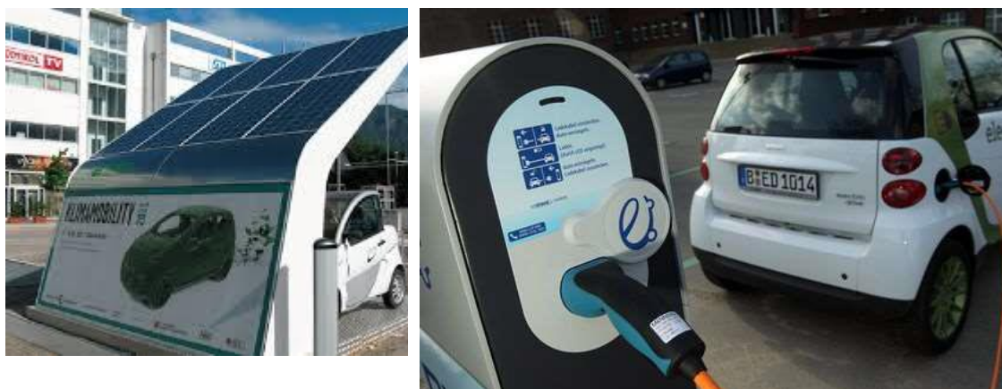
Figura 5 – Cobertura fotovoltaica de parques de estacionamento

Fonte: https://www.floersheim-main.de/media/custom/2181_2927_1.PDF?1450343755