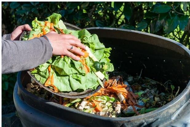
Figura 9 – Recolha de resíduos orgânicos na restauração