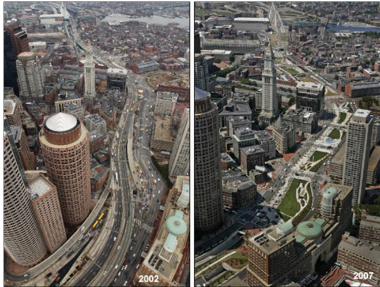
Figura 3 – Projeto de revitalização urbana em Boston