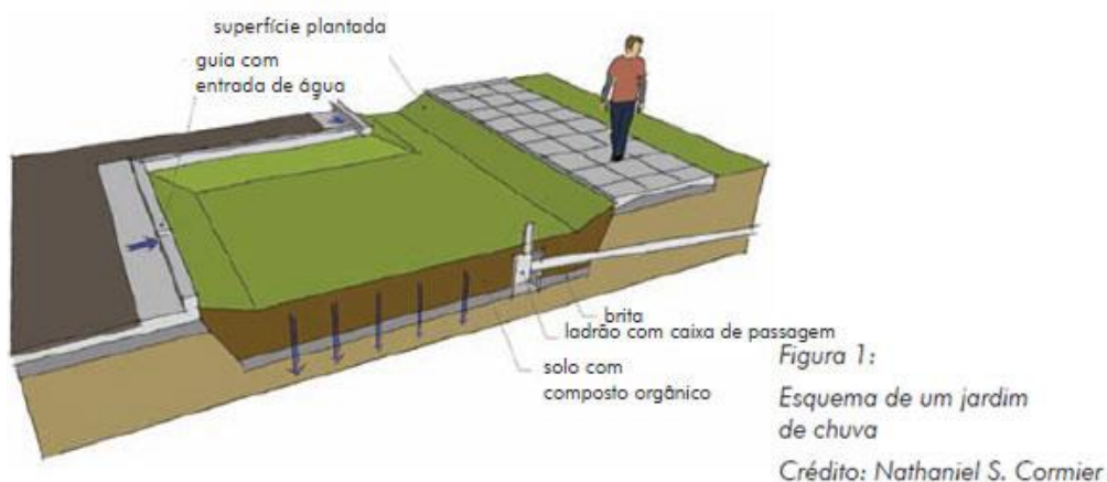
Figura 8 – Esquema de um jardim chuva

Desta forma, com os jardins chuva e as coberturas e telhados verdes ocorre uma melhoria de funcionamento do sistema hidrológico.