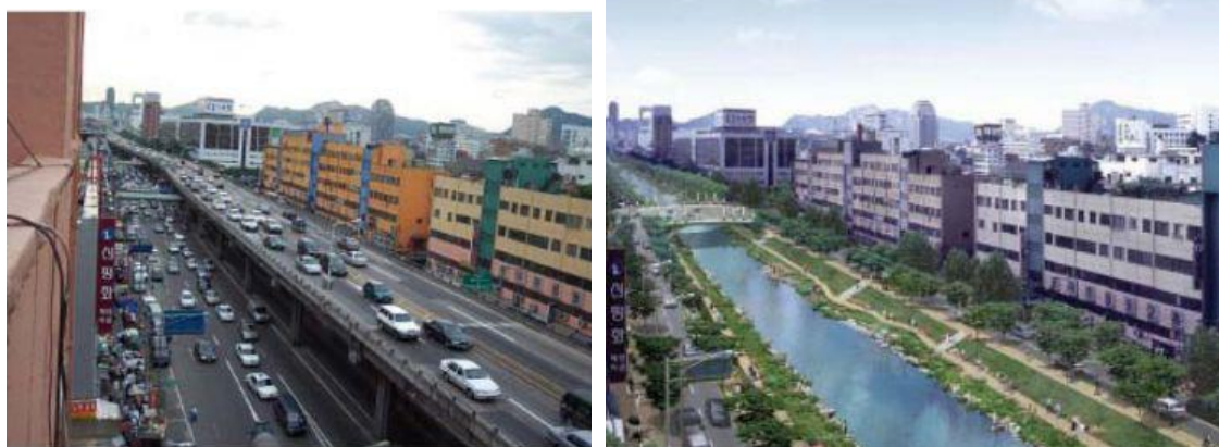
Figura 2 – Projeto de revitalização urbana em Seul

Seul (Coreia do Sul) – Cheonggyecheon Stream Restoration Project https://landscapeperformance.org/case-study-briefs/cheonggyecheon-stream-restoration