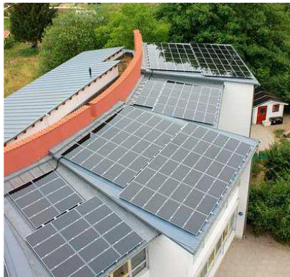
Figura 6 – Painéis fotovoltaicos em telhados dos edifícios