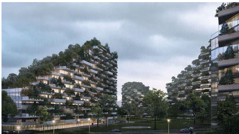
Figura 7 – Coberturas e fachadas verdes

Imagem da futura cidade verde de Liuzhou na China