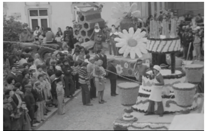
Figura 3 - Fotograma de um dos video loops tocados no tema “Corridinho”, autoria Ana Perfeito, 2018.

Uma delas, recebeu o nome provisório de Corridinho, inicialmente porque foi inspirado no ritmo da música tradicional Algarvia com o mesmo nome. Esta foi tocada com os três acordeões em simultâneo e acompanhada por ritmos de música digitais. Visualmente, foram projetados clips que continham imagens do Carnaval de Vila Real de Santo António de 1973 (ver exemplo na figura três).