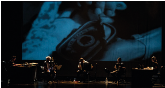
Figura 1 – Moda Vestra ao vivo no cineteatro Louletano, fotógrafa Camile Leon, 2018.

No vídeo, foram utilizados clips que remetiam para ambientes antigos (e.g. excertos do carnaval de Vila Real de Santo António de 1973), outros clips remetiam para o Algarve contemporâneo (e.g. viagem contínua pela estrada Nacional 125), e ainda outros que remetiam para a natureza (e.g. filmagens subaquáticas na costa).