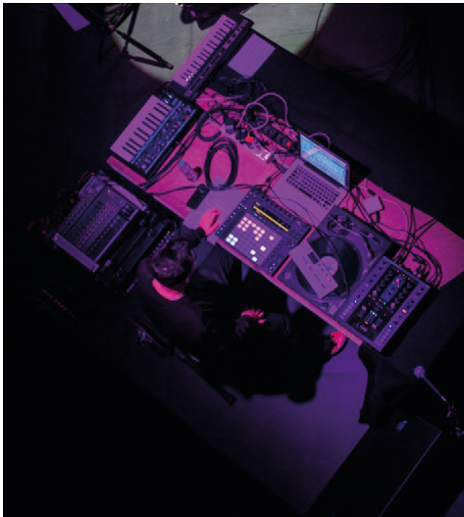
Figura 2 - Mesa do produtor musical, ao vivo em Moda Vestra , fotografa Camile Leon, 2018.

O processo de criação —visual e sonoro— aconteceu em simultâneo. Diferente de outros projetos do mesmo género em que a cineasta já tinha participado. Nesses projetos, ela criou visuais para bandas que já tinham músicas prontas, não havendo a hipótese de a música receber inputs dos vídeos. Em Moda Vestra isso pôde acontecer, pois foi um projeto audiovisual de raiz.