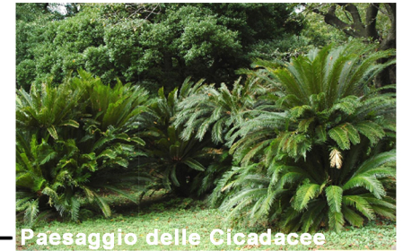
Paesaggio delle Cicadacee