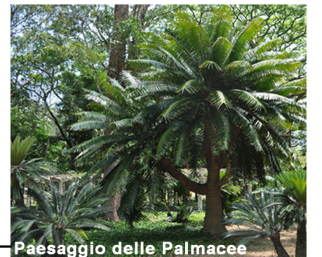
Paesaggio delle Palmacee

il Paesaggio fluviale occupa la quota più bassa del giardino e la vegetazione è costituita da specie fra cui: Ailanto, Robinia, Olivastro, Fico d'India, Oleandro, Ampelodesma, Ginestra di Spagna, Tamerice, Sambuco, Euforbia. Oltre a piccole piante come la Menta, la Canapa acquatica, il Cardo Cretico, il Sedano d'acqua, la Veronica acquatica, il Ranuncolo, la Lenticchia d'acqua e Felci.