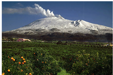
Paesaggio della piana Il Paesaggio della piana è caratterizzato dalla presenza degli agrumi a memoria del paesaggio agricolo siciliano.