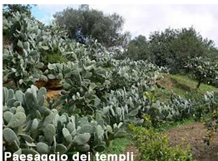
Paesaggio dei templi Il Paesaggio dei templi peculiare per la presenza di piante quali: Ulivo, Mandorlo, Pistacchio, Alloro, Mirto, Ulivo, Melograno, Acanto, Carrubo.