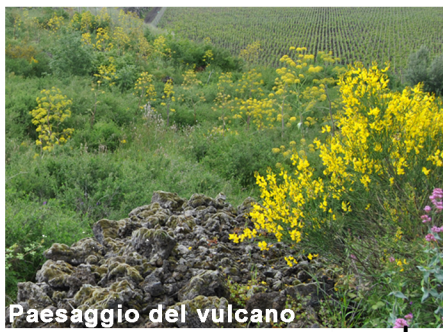
Paesaggio del vulcano

Alla quota più alta del giardino troviamo quindi il Paesaggio del vulcano (Etna) dove la lava fa da protagonista in forma di scorie e sabbia vulcanica, colonizzata da biotopi di vegetazione specifica della zona (ginestra, asparago, quercie, etc.), che puntualmente lasciano spazio al paesaggio antropizzato riconoscibile dalla presenza di vitigni autoctoni (Nerello Mascarese, Nerello Cappuccio, Carricante, Cataratto, Minnella) da cui si ricavano i pregiati vini dell'Etna D.O.C.