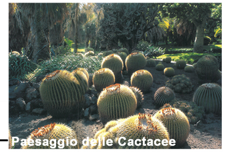
Paesaggio delle Cactacee

Alla quota più alta del giardino troviamo quindi il Paesaggio del vulcano (Etna) dove la lava fa da protagonista in forma di scorie e sabbia vulcanica, colonizzata da biotopi di vegetazione specifica della zona (ginestra, asparago, quercie, etc.), che puntualmente lasciano spazio al paesaggio antropizzato riconoscibile dalla presenza di vitigni autoctoni (Nerello Mascarese, Nerello Cappuccio, Carricante, Cataratto, Minnella) da cui si ricavano i pregiati vini dell'Etna D.O.C.