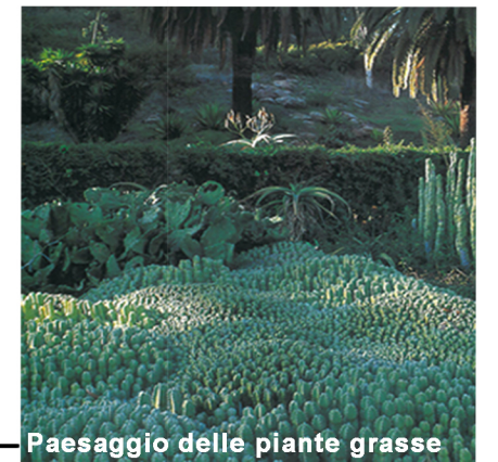
Paesaggio delle piante grasse