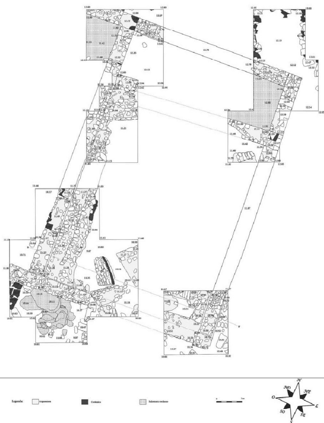
Anexo.3. Planta da cisterna e do compartimento a Norte, segundo João Pedro Bernardes (2008b)