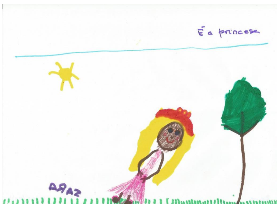
Figura 6 – Desenho sobre o conto O Bói-Bumbão