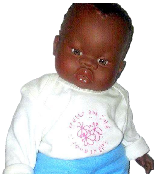
Figura 2 – O Jeremias

Depois de contar a história, o Jeremias ficou na sala de atividades. Participou nas rotinas do grupo e fez parte das brincadeiras e das conversas diárias. Ajudou-nos também a introduzir algumas temáticas importantes a trabalhar com as crianças. Relembrou regras da sala, e falou sobre valores como a solidariedade e o respeito pela diferença. Este trabalho com o Jeremias teve como intenção aproximar as crianças da diferença, mostrar-lhes as suas qualidades e promover a sua aceitação.