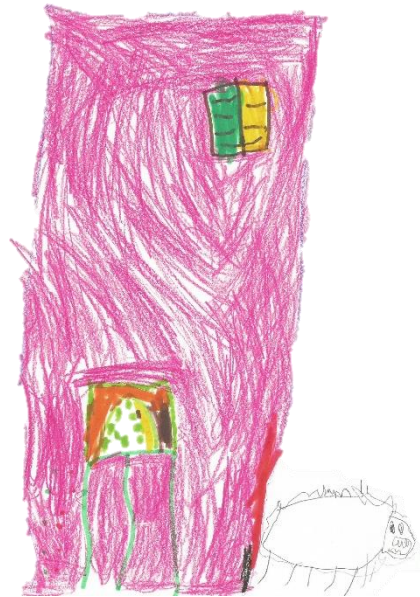
Figura 4 – Desenho sobre o lobo

Também estes desenhos aparecem elaborados com bastante pormenor e evidenciam uma grande dedicação por parte das crianças. Acreditamos que este seja um sinal de que o grupo continuava a gostar do projeto e tinha gostado da história que foi explorada.