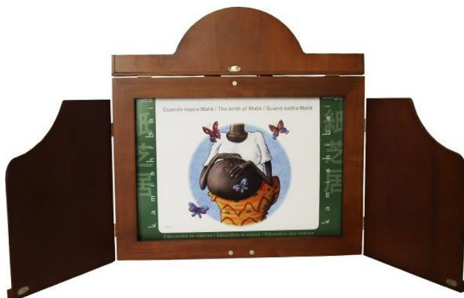
Figura 1 – Kamishibai

O kamishibai pode também ser denominado como «teatro de papel». Tendo a sua origem e a sua maior popularidade no Japão, este é um recurso utilizado para contar contos, que também se estendeu a outros países. Atualmente, no campo da pedagogia, este é um instrumento encarado como um importante recurso didático, uma técnica mágica que suscita a concentração, a expectativa e o divertimento das crianças quando ouvem uma interpretação a partir do mesmo. (Aldama Jiménez 2005:1)