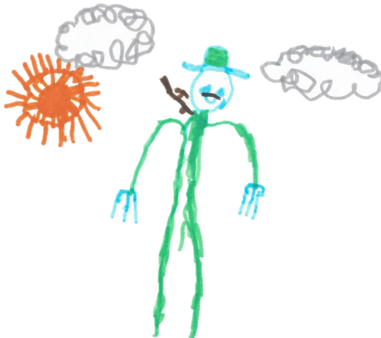
Figura 3 – Desenho de C3 sobre o caçador, a personagem favorita.

Durante a realização desta atividade, foi também para nós importante ouvir os comentários que as crianças faziam enquanto desenhavam e enquanto partilhavam ideias sobre as personagens. Neste contexto, notámos também que houve mudanças na perspetiva e na forma de pensar das crianças perante a figura do lobo, perante a própria história e perante as restantes personagens.