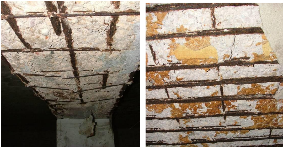
Figura 4. Deterioração de elementos estruturais de betão armado.

Cerca de 31,5% dos edifícios de betão armado analisados apresentaram sinais de degradação. Este conjunto de patologias mostrou ser dependente da idade dos edifícios, sendo mais comum nas estruturas mais antigas.