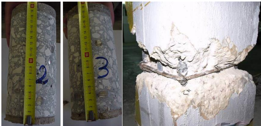
Figura 8. Existência de recobrimentos com espessuras elevadas.

Também a existência de recobrimentos excessivos, em particular nas armaduras superiores das lajes, constitui uma situação frequente, originando uma redução, em muitos casos significativa, da altura útil efetiva destes elementos estruturais. Em consequência a resistência mecânica é fortemente penalizada e a deformação, sobretudo a longo prazo, aumenta significativamente.