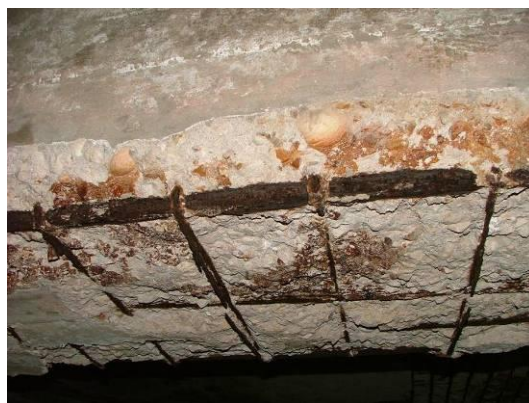
Figura 6. Extração de betão e presença de conchas marinhas.

Noutros casos, o teor de cloretos diminuía com a profundidade de extração das amostras, o que revela uma penetração após aplicação do betão em obra, principalmente em elementos exteriores da periferia dos edifícios, particularmente nas fachadas expostas a Sul.