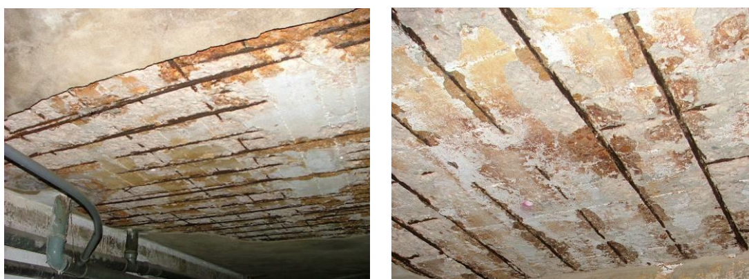
Figura 7. Existência de recobrimentos insuficientes.

Analisaram-se alguns projetos de estabilidade em que não eram mencionados os recobrimentos mínimos a respeitar. Desde 1983, que as espessuras mínimas de recobrimento estão regulamentadas no R.E.B.A.P. [2], e, posteriormente, na especificação LNEC E 464 [3] e também na norma europeia NP EN 206-1 [1]. Mais recentemente, na NP EN 1992-1-1:2010 [4], referente a estruturas de betão, preconizam-se condições idênticas visando a durabilidade das estruturas, sobretudo em condições ambientais desfavoráveis.