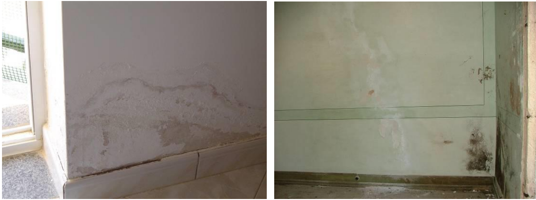
Figura 3. Diversas manifestações de humidade (eflorescências, bolores, levantamento do revestimento, vegetação parasitária).