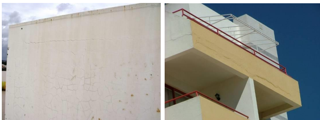
Figura 1. Fissuração não estrutural na interface entre materiais diferentes (betão e alvenaria) e em rebocos.

No caso da ligação entre diferentes materiais, o diferente comportamento destes face a condições ambientais diversas, designadamente a variações térmicas e higrométricas, provoca o desligamento entre eles e a consequente fissuração que, nestas circunstâncias, apresenta uma orientação perfeitamente definida, normalmente horizontal ou vertical, correspondente à ligação entre os materiais (por exemplo entre betão armado e alvenaria).