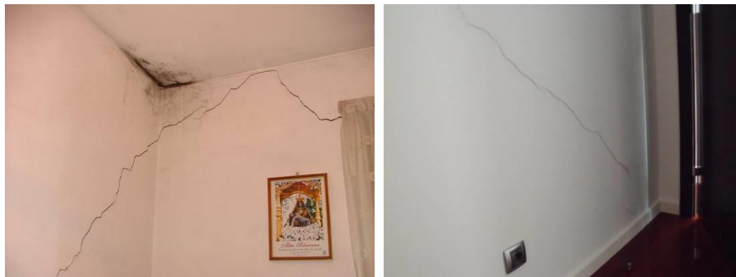
Figura 2. Fissuração de origem estrutural em alvenarias e rebocos.

Na maior parte dos casos resultam de assentamentos diferenciais a nível da infraestrutura e de abatimentos. Para além das condições do terreno, também resultam, por vezes, de deficiência de construção e/ou de projeto.