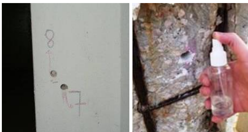
Figura 5. Aplicação de indicador para determinação da profundidade de carbonatação.

A avaliação deste fenómeno é efetuada através do aspergimento com solução alcoólica de fenolftaleína, que, de forma expedita permite determinar a camada carbonatada e a consequente possibilidade de despassivação das armaduras, e consequente criação de condições favoráveis à corrosão.