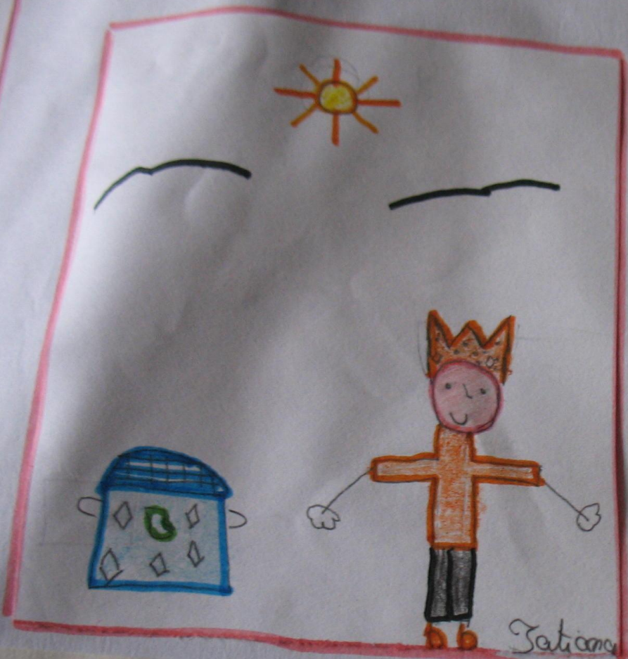
O Rei oferece uma recompensa a quem lhe trouxer o boi Blimundo.