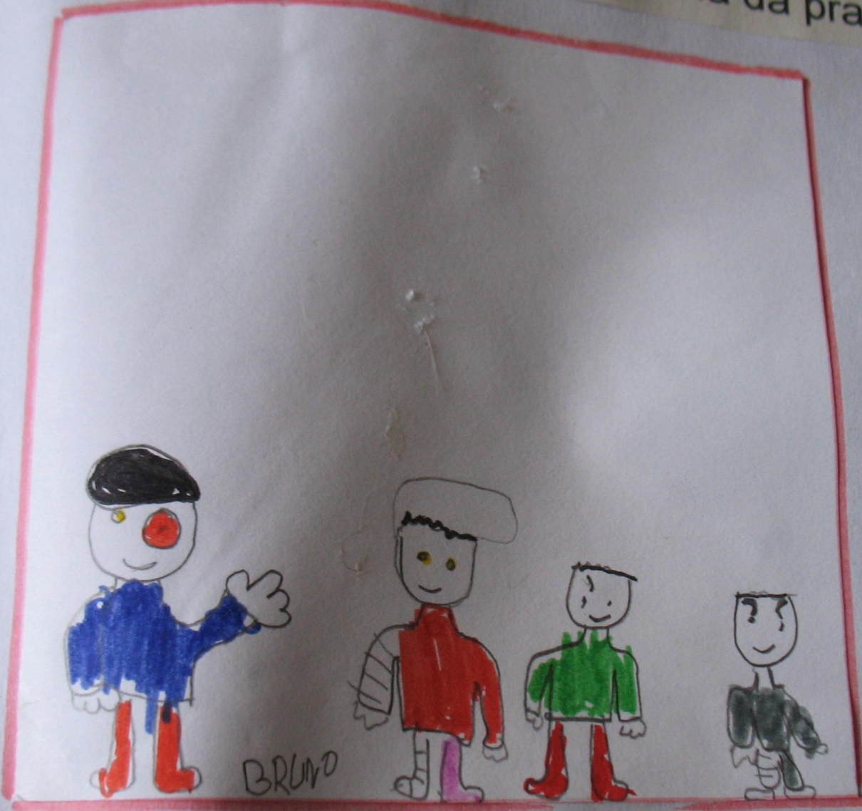
Os soldados feridos.