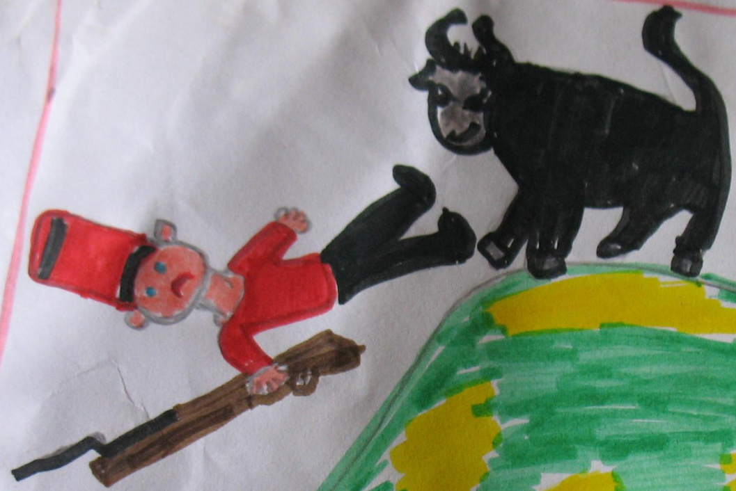
O boi dá uma cornada nos soldados.