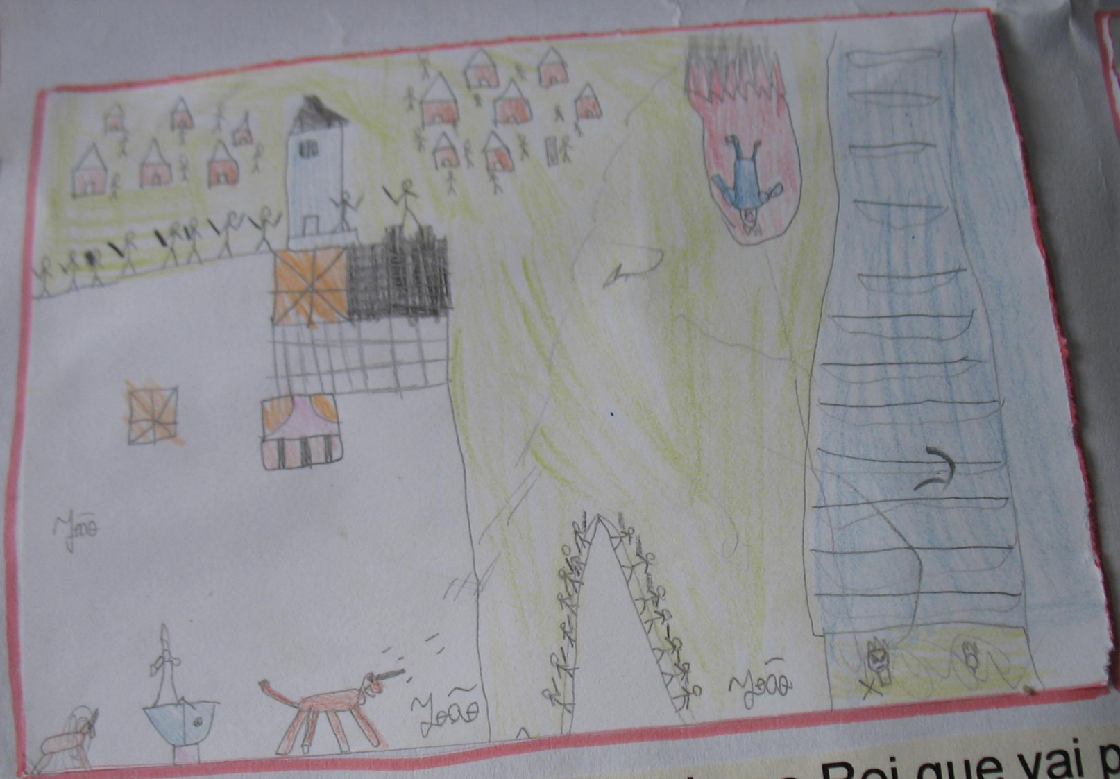
O boi Blimundo dá uma cornada ao Rei que vai parar à praia e fica com a cabeça enterrada na areia.