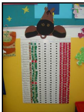
IMAGEM I – Mapa das presenças

Efectivamente, há uma grande variedade de materiais disponíveis e ao alcance das crianças, para que os possam utilizar autonomamente. Existem também placares onde são colocados os trabalhos das crianças e nas paredes estão alguns mapas de organização, como o mapa das presenças e o mapa do tempo, que todos os dias são preenchidos pelas crianças.