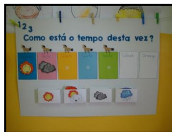
IMAGEM II – Mapa do tempo

O mapa das presenças foi construído com a ajuda das crianças; neste mapa, na vertical, está o nome de cada uma das crianças com a respectiva fotografia para facilitar o reconhecimento do seu nome e, na horizontal, estão os dias da semana. Com o preenchimento diário do mapa, as crianças conseguem ter a percepção do dia da semana e das que estão a faltar. Com este mapa de presenças, familiariza-se as crianças com a tabela de dupla entrada, pois estas têm que associar o seu nome ao dia da semana, quando o preenchem.