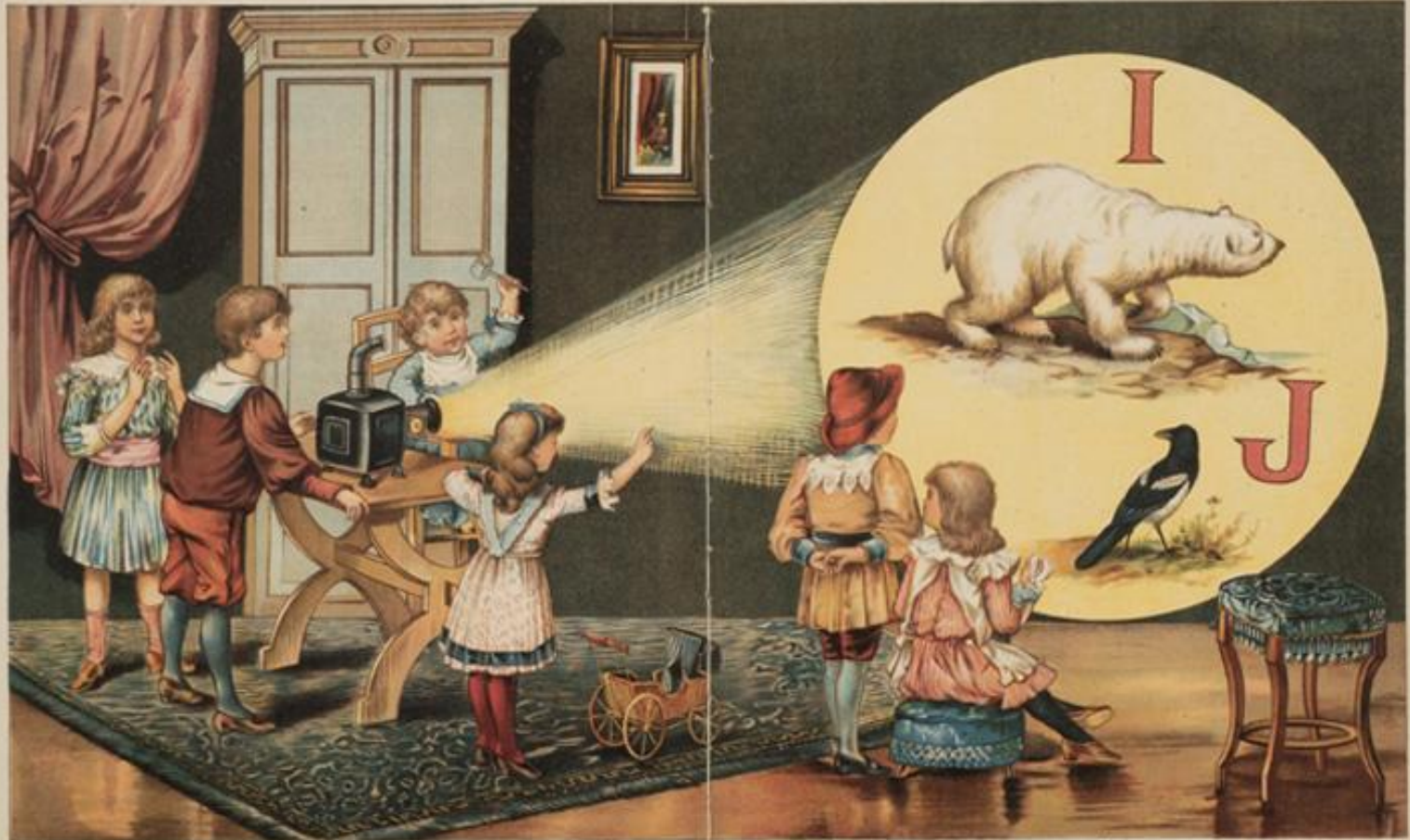
| ICEBEAR J JACKDAW

As lanternas tornaram-se muito populares entre as crianças, na época.