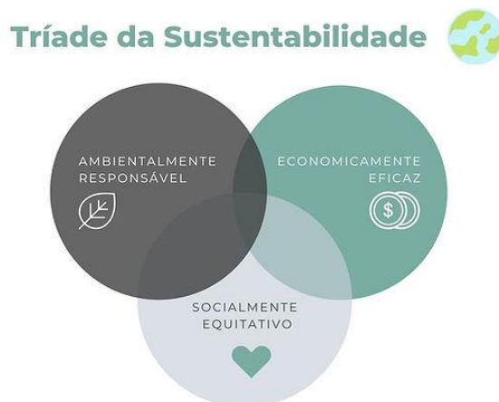
Figura 1. As dimensões da sustentabilidade.

É realmente um desafio avaliá-las e quantificá-las com precisão, especialmente os fatores ambientais e sociais (Goh, Chong, Jack e Faris, 2020).