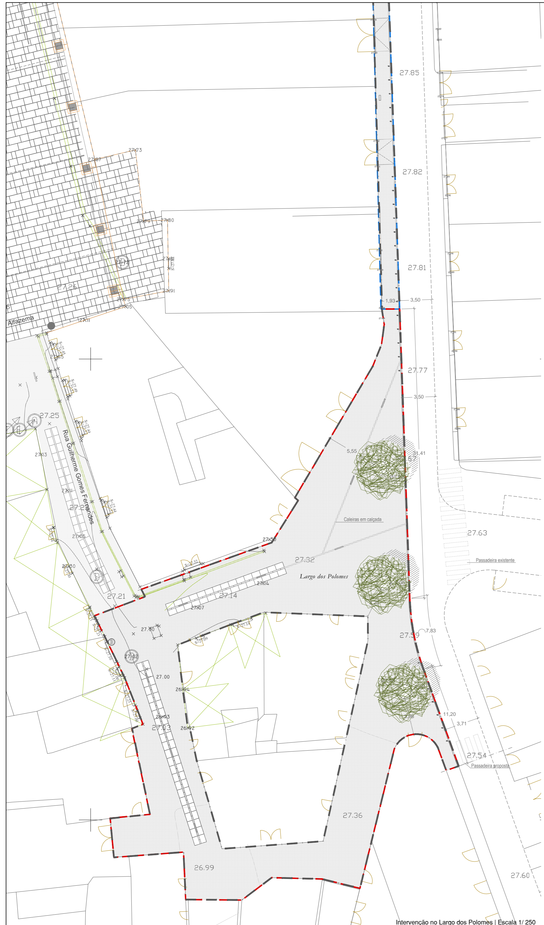
Intervenção no Largo dos Polomes | Escala 1/250