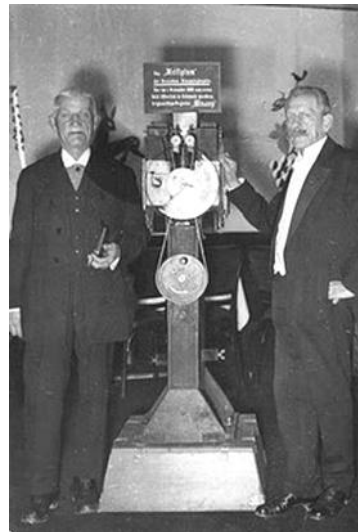
Eugen e Max Skladanowsky

Foi no Wintergarten em Berlim, situado na Martin Luther Strasse, que se realizaram as primeiras projecções de cinema para um público pagante. A 1 de Fevereiro de 1907, o jornal alemão Der Komet atribuiu a invenção do cinema a Max Skladanowsky iniciando uma polémica com os jornalistas franceses sobre a data do seu início.