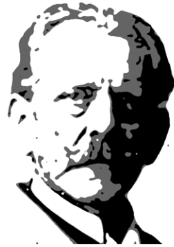
Max Skladanowsky Nasceu em: Berlim, 30 de Abril de 1863 Faleceu em: Berlim, 30 de Novembro de 1939