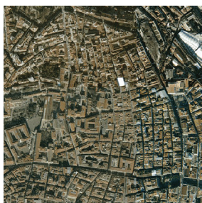
Tecido urbano do Bairro Alto