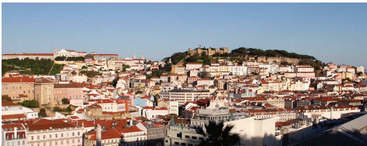
Mouraria entre Castelo e Martim Moniz

La protection stratégique des tissus anciens et leur réappropriation par des populations qui les habitent au lieu de les consommer passe par une autre voie... les associations de défense s'orientent dans cette direction et s'opposent avec un succès croissant aux projets techniques ou spéculatifs qui lèsent leurs quartiers. On ne répétera jamais assez l'avertissement de Giovannoni: les centres et les quartiers anciens ne pourront être conservés et intégrés dans la vie contemporaine que si leur nouvelle destination est compatible avec leur morphologie et leur échelle. On a vu les dangers représentés par leur mise en valeur culturelle et touristique. (Choay, 1992, p. 185)