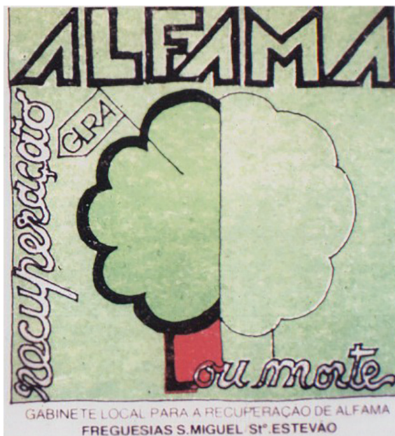
Autocolante do manifesto de Alfama

Aqui cabe relatar a satisfação de Françoise Choay quando, em 1998, tomou conhecimento da Reabilitação Urbana de Lisboa por coincidir com as hipóteses que avançava no fim do seu livro L'Allégorie du Patrimoine :