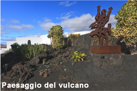
Paesaggio del vulcano