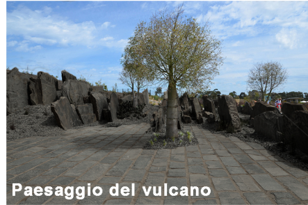
Paesaggio del vulcano