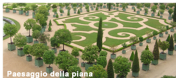
Paesaggio della piana

Citrus fortunilla margarita (kumquat) Citrus mitis (citrofortunella microcarpa) Citrus paradisi (pompelmo) Citrus reticulata (mandarino) Citrus reticulata Clementine Citrus tangelo (mapo) Citrus aurantium (arancio amaro) Citrus limon (limone) Citrus sinensis (arancio)