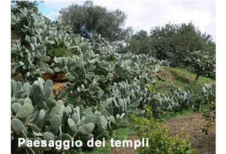
Paesaggio dei templi