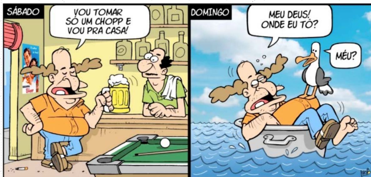
Figura 3: Tirinha de Edibar.

protagonista, em teoria, passa a maior parte do tempo. A única tira das dezoito analisadas em que o Edibar não aparece é uma que reforça a imagem da mulher de meia-idade com problemas de excesso de peso que não resiste em ir ao frigorífico de madrugada procurar comida.