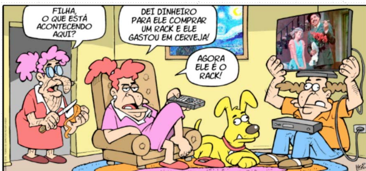
Figura 2: Tirinha de Edibar. Fonte: https://aspectus-online.com/edibar.html

e a mulher às tarefas domésticas, na cozinha ou nas limpezas – nas piadas de Edibar aqui analisadas não é muito acentuado. Se bem que não existe uma situação em que Edibar esteja em qualquer atividade doméstica que não seja sentado ou deitado no sofá. Há uma piada em que Edibar é obrigado a segurar o televisor e a substituir o respetivo móvel de apoio por ter gasto o dinheiro que era para comprar o “rack” em cerveja (Figura 2), reforçando a ideia estereotipada que em casa quem manda é ela – de dezoito piadas, quatro reforçam isso. Todavia, nem todas as piadas colocam a Edimunda exclusivamente em trabalhos domésticos: em duas ela está na poltrona, frente à TV, e só em uma se encontra a lavar a louça. Já Edibar, de três piadas em que se encontra em casa, em duas está no sofá assistindo à televisão, em uma junto com Edimunda e noutra a ler o jornal à mesa.