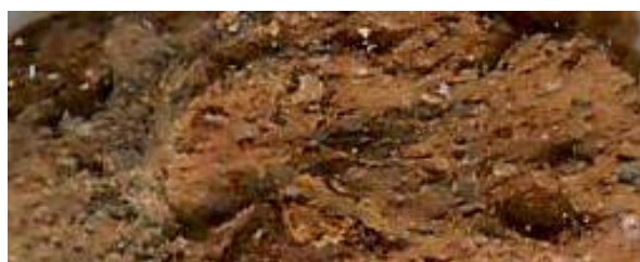
Fig.21. Pasta tipo 3.