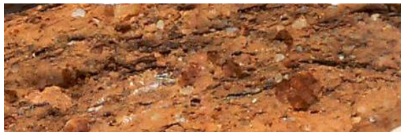
Fig.20. Pasta tipo 2.

Pertencem a este grupo 34 fragmentos, sendo 10 deles fragmentos do tipo Almagro 51c, 22 fragmentos do tipo Almagro 51 a/b, 1 fragmento do tipo Almagro 50 e 1 fragmento do tipo aff Beltrán 65a.