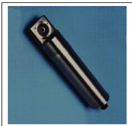
Fig. 1. Nefelómetro Aquatracka III.

Este equipamento, que emite e detecta comprimentos de onda do azul escuro do espectro visível (perto dos ultravioletas), é particularmente sensível a partículas relativamente pequenas (raio menor que 440nm) que selectivamente dispersam pequenos