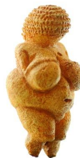
Vénus de Willendorf

Parece que o Homo Sapiens tinha em conta as qualidades de geração, fertilidade e proteção nutricional, identificando a mulher com a Terra... quem é senão a mulher que cuida da sua prole e se encarrega de satisfazer as suas necessidades básicas? Esta pode ser a razão pela que a humanidade prosperou, debaixo da proteção da figura feminina, no período entre cerca de 30000 a.C. a 3000 a. C. – Vénus de Willendorf (Pimiento, 2003).