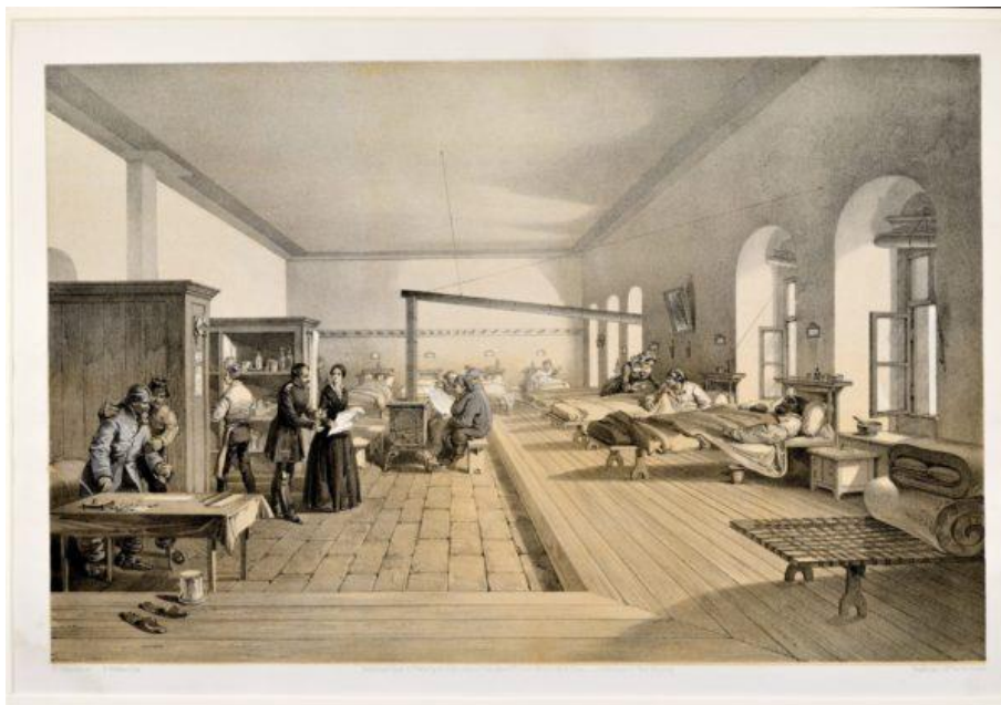
Florence Nightingale em Scutari Hospital https://www.florence-nightingale.co.uk/scutari-hospital/

Nessa altura decorre a guerra da Crimeia (1854-1856). Em 1854 foi nomeada Superintendente do Corpo Feminino das Enfermeiras das Forças Inglesas, estabelecidas no Hospital Geral Inglês da Turquia.