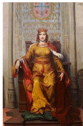
Retrato imaginado da Rainha D. Leonor, por José Malhoa (1926).

O Compromisso, existiu em todos os locais de Portugal, facilitando a ajuda na saúde às pessoas que mais necessitavam, incluindo a visita aos doentes até à sua cura, sempre ligados à Santa Casa da Misericórdia. É possível encontrarmos alguns registos em vários locais do Algarve. Em Tavira, no Antigo Hospital de Tavira, podemos encontrar um pequeno museu dedicado aos cuidados de saúde, onde estão expostos alguns instrumentos da prática da Medicina e da Enfermagem (Nota da autora).