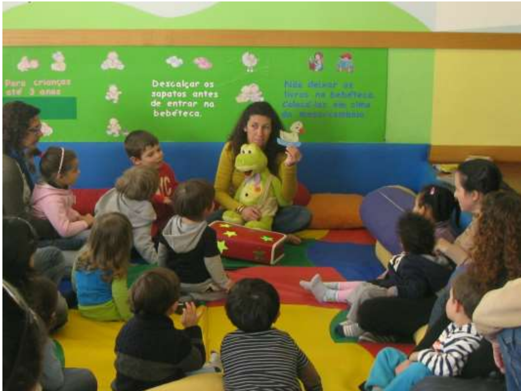
Foto 9 - 'Barriga cheia de histórias'