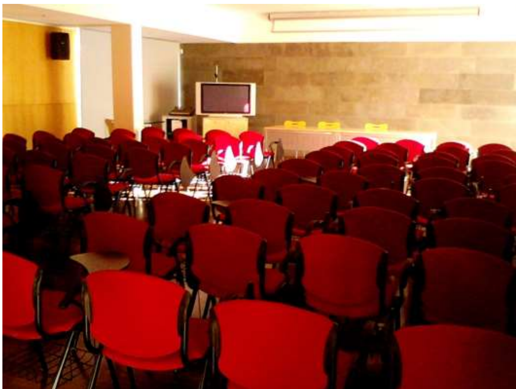
Foto 7 - Sala Polivalente