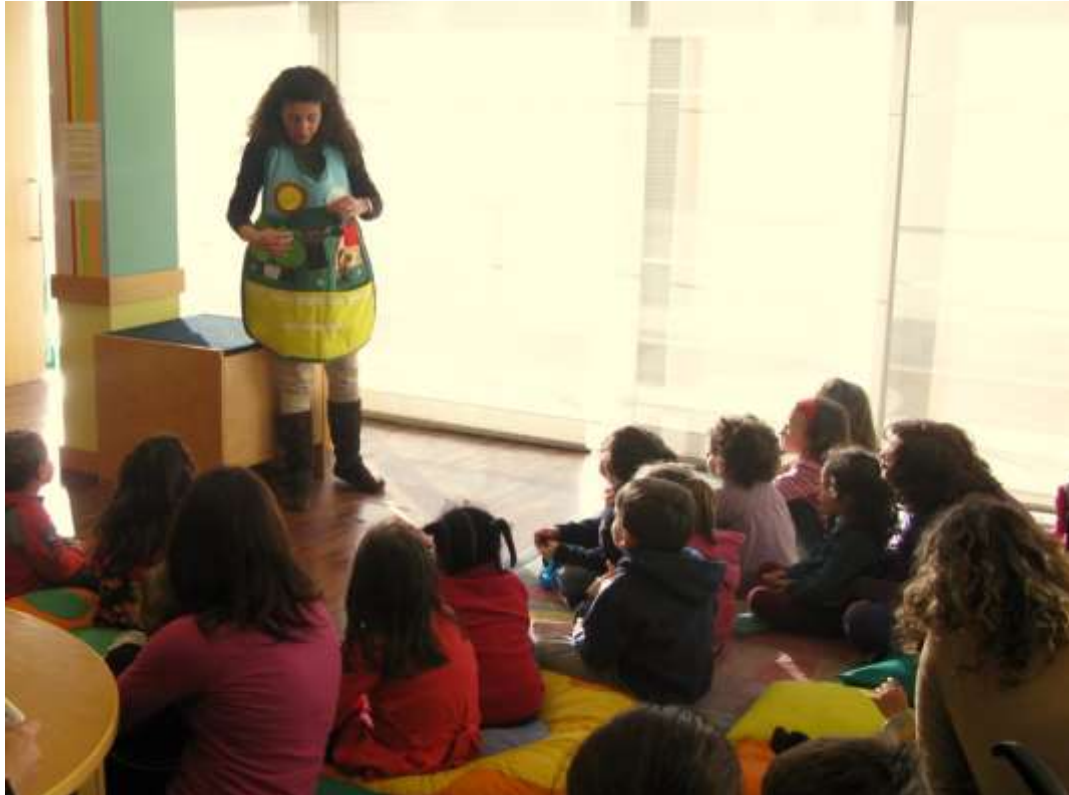
Foto 10 - 'Avental de histórias'