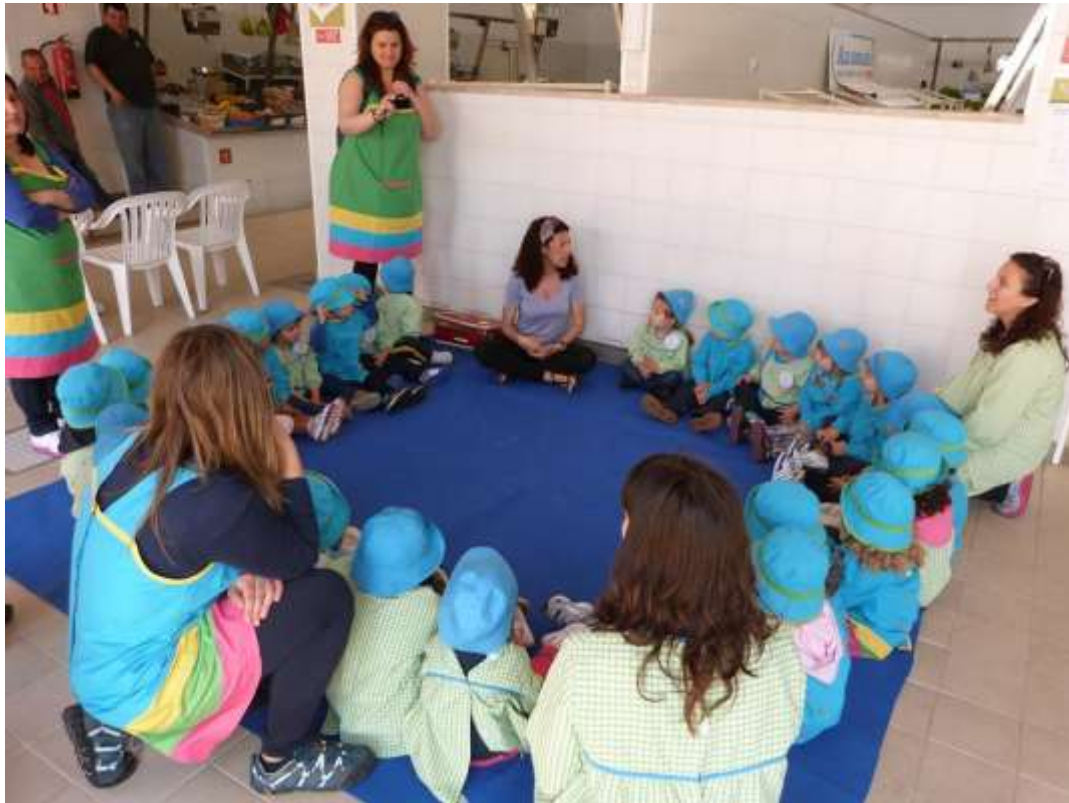
Foto 13 - 'Avental de Histórias' no Mercado Municipal dos Caliços