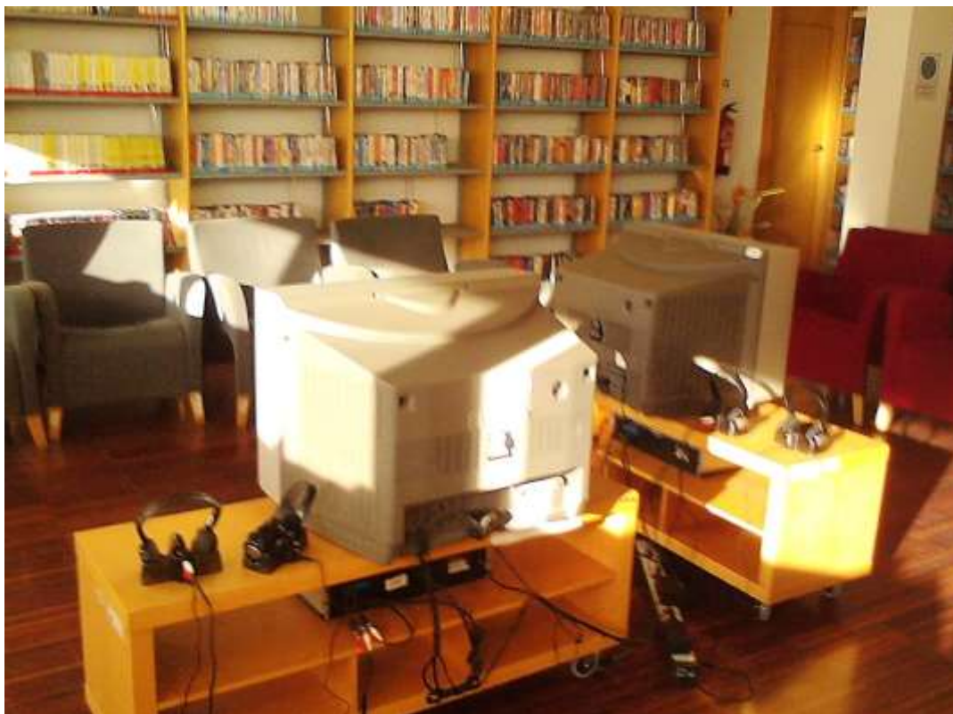
Foto 4 - Sala dos Audiovisuais