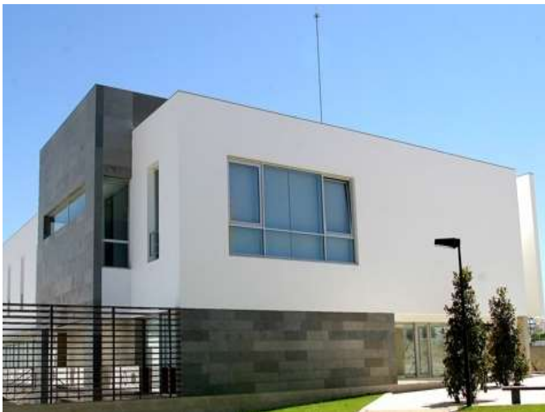
Foto 1 - Biblioteca