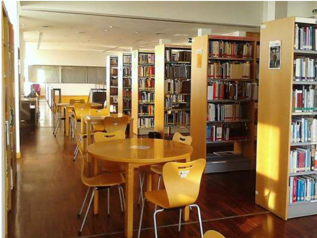
Foto 5 - Sala de Formação e Leitura