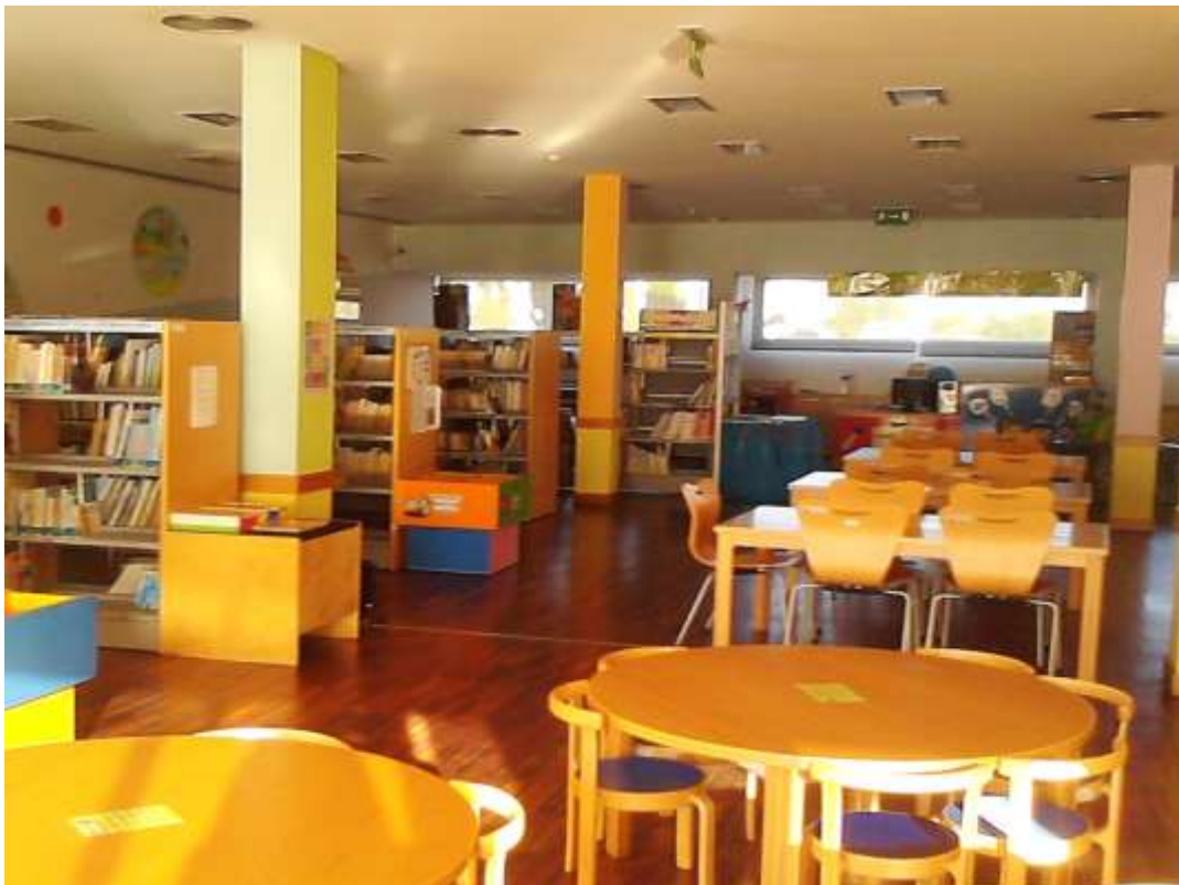
Foto 6 - Sector infanto-juvenil