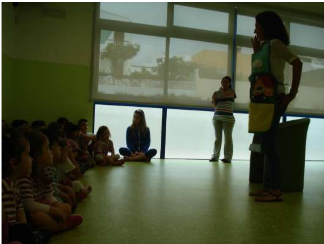
Foto 14 - 'Avental de Histórias' na creche/jardim de infância Academia dos Marinheiros