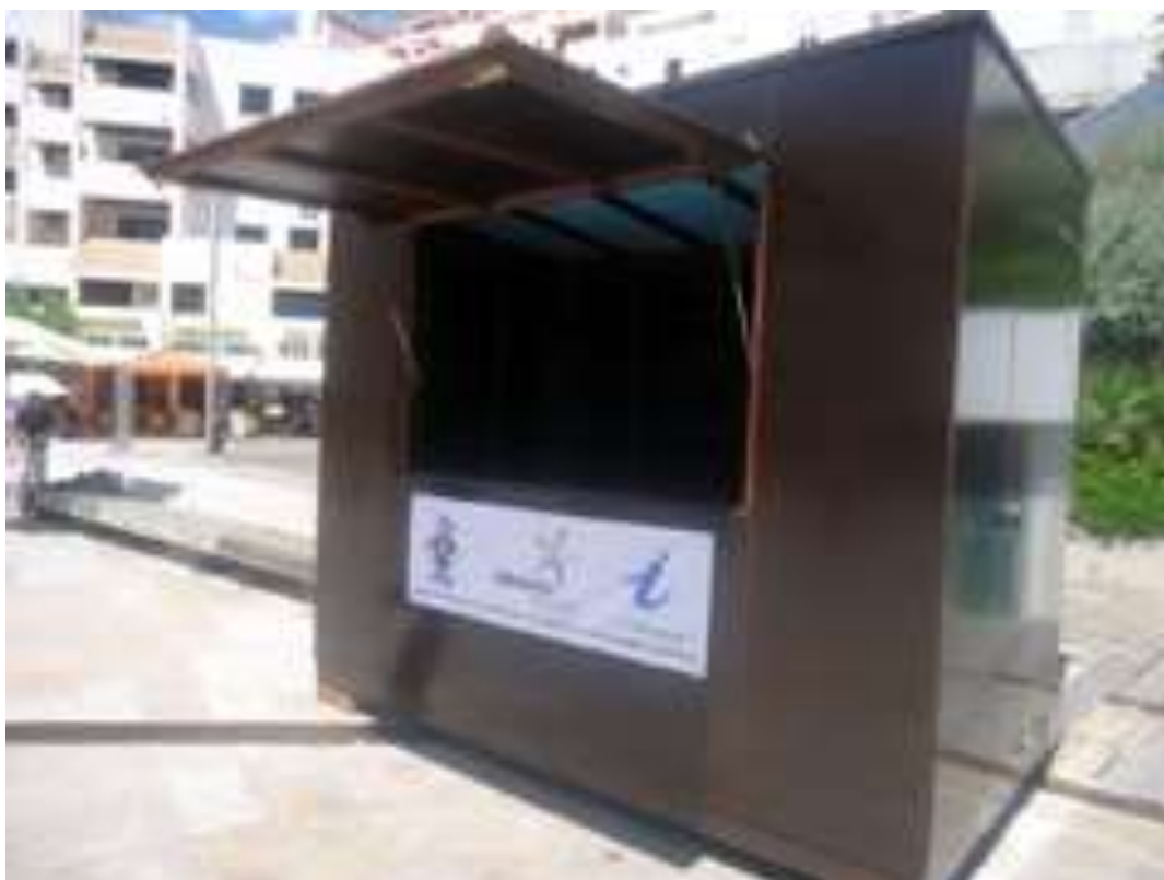
Foto 8 - Biblioteca de praia