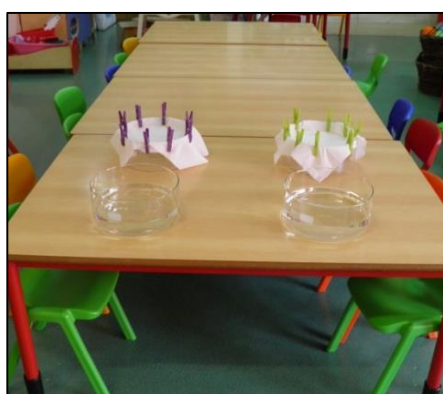
Figura 3. 3 Organização do material para a atividade experimental.

Durante todo o processo fomentámos a participação do grupo realizando perguntas, de formar a fazê-los refletir e também como forma de averiguar se estavam atentos à atividade.