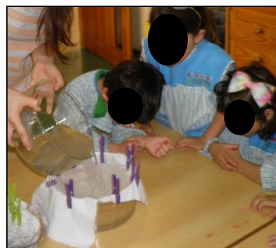
Figura 4. 6 Fotografia (f2) observação da "sujidade" no filtro.