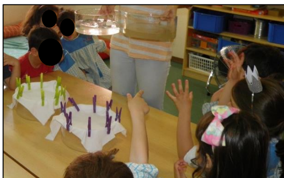
Figura 4. 5 Fotografia (f1) participação das crianças na atividade experimental.

Após a realização da atividade foram vários os momentos em que as crianças do grupo mostraram preocupação na lavagem das mãos, tal como se pode ver «as minhas mãos estão muito lavadinhas, agora posso comer com as mãos, não é Mariana?» (apêndice IX, (nc11), 20 de abril, criança 14). Ou também «cheira as minhas mãos, lavei com sabonete e mexi [esfreguei] muito tempo» (apêndice IX, (nc12), 4 de maio de 2015, criança 3). Estes comentários demonstram que as crianças adquiriram conhecimentos e os hábitos por nós desejados, i.e, implementámos uma atividade de promoção de saúde.