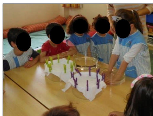
Figura 3. 4 Crianças a realizar a primeira parte da atividade experimental.