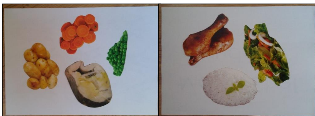
Figura 4. 7 Fotografia (f3) Pratos alterados das equipas 2 e 3, respetivamente.

A constituição dos pratos mostrou que apenas a equipa 1 tinha conhecimento acerca da alimentação. Sendo esta uma atividade para promover a alimentação saudável, no final falámos sobre cada prato realizado pelas equipas, de maneira a reconstruir conhecimento dos alimentos apresentados. Por sugestão, várias crianças das equipas 2 e 3 quiseram reconstruir os seus pratos com uma composição mais saudável. Este momento foi muito importante para nós, pois pela iniciativa que tiveram denotou-se as aprendizagens que adquiriram e a motivação em melhorar a alimentação (ver figura 4.7 (f3)).