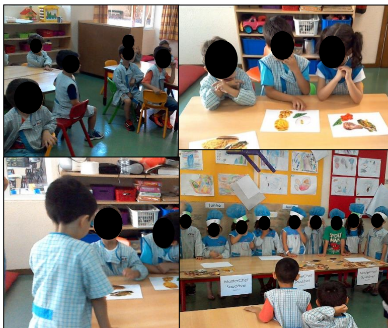
Figura 4. 8 Fotografia (f4) Participantes a interpretarem as suas personagens no role playing game .

informação que desejávamos para uma alimentação saudável» (apêndice IX, (nc15), 20 de maio).