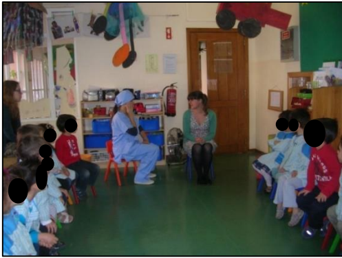
Figura 3. 1 Organização do espaço para a dramatização.