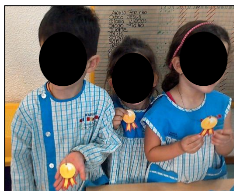
Figura 3. 6 Crianças com medalhas.