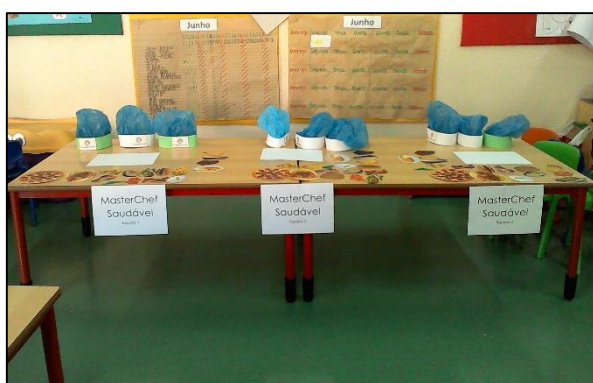
Figura 3. 5 Bancada dos cozinheiros no role playing game .

No final da atividade todos decidiram a equipa vencedora e os jurados ofereceram as medalhas. Nesta entrega decidimos oferecer uma medalha não apenas aos vencedores do concurso como também a todos os participantes (ver figura 3.6).