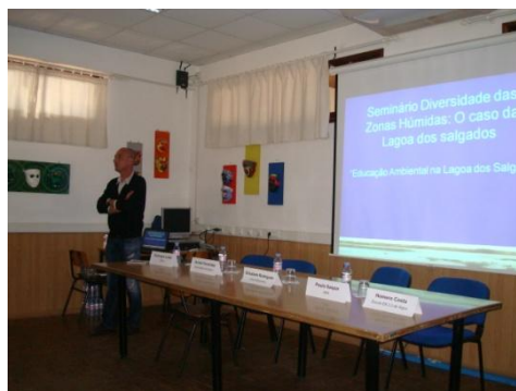
Foto 10 - 4ª Comunicação do Painel II