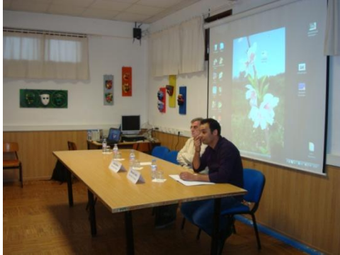
Foto 1 - Sessão de Abertura