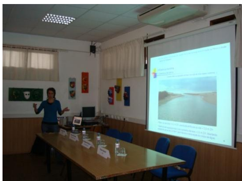
Foto 7 - 1ª Comunicação do Painel II