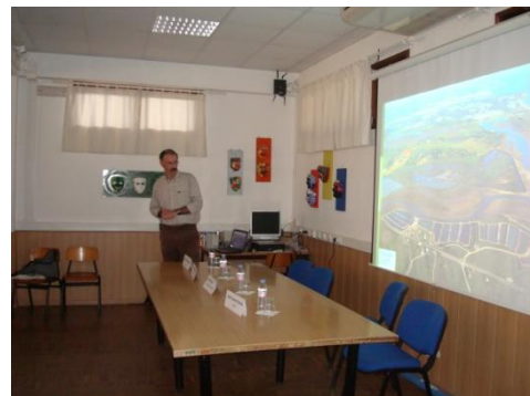
Foto 4 - 3ª Comunicação do Painel I