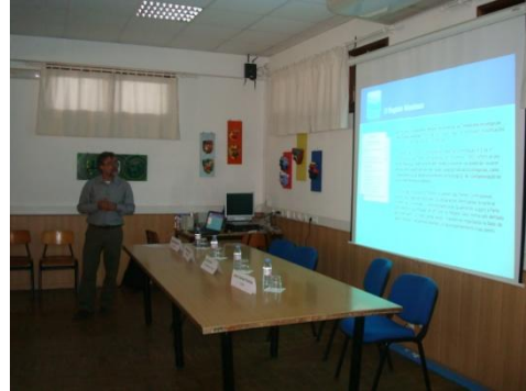
Foto 2 - 1ª Comunicação do Painel I