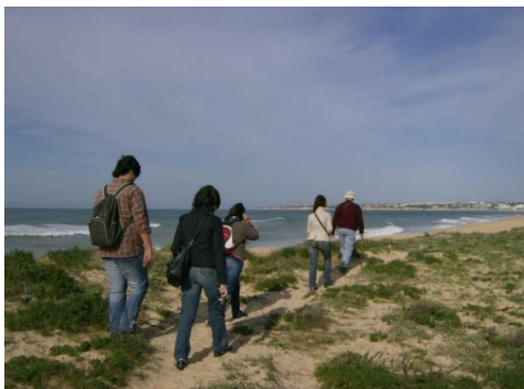
Foto 13 - Seguindo o Trilho das Dunas