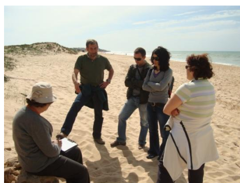
Foto 18 - Observação de alguns exemplares existentes na praia