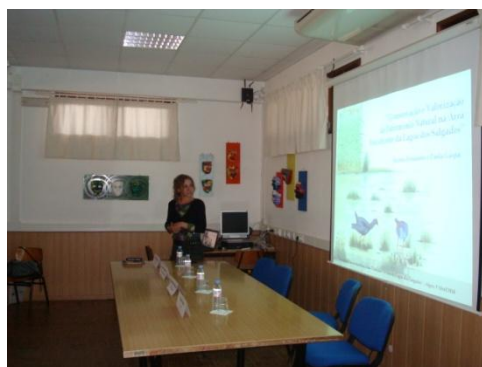
Foto 8 - 2ª Comunicação do Painel II