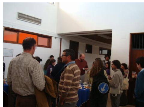
Foto 6 - Coffee-break