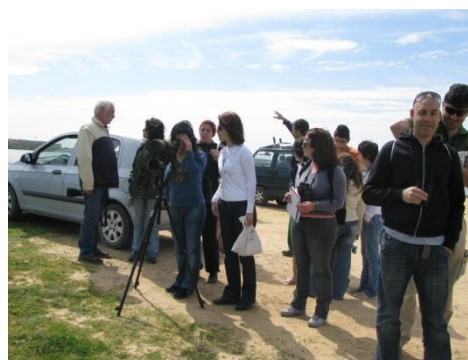
Foto 16 - Mais um momento de paragem para observação de algumas espécies de aves