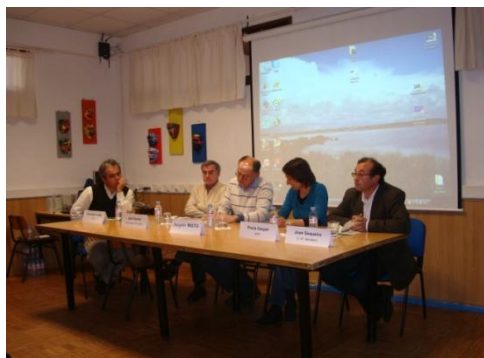
Foto 11 - Mesa Redonda