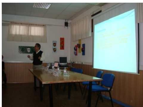
Foto 9 - 3ª Comunicação do Painel II