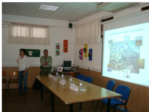
Foto 3 - 2ª Comunicação do Painel I