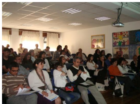
Foto 12 - Plateia Assistente