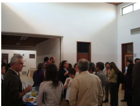
Foto 5 - Coffee-break