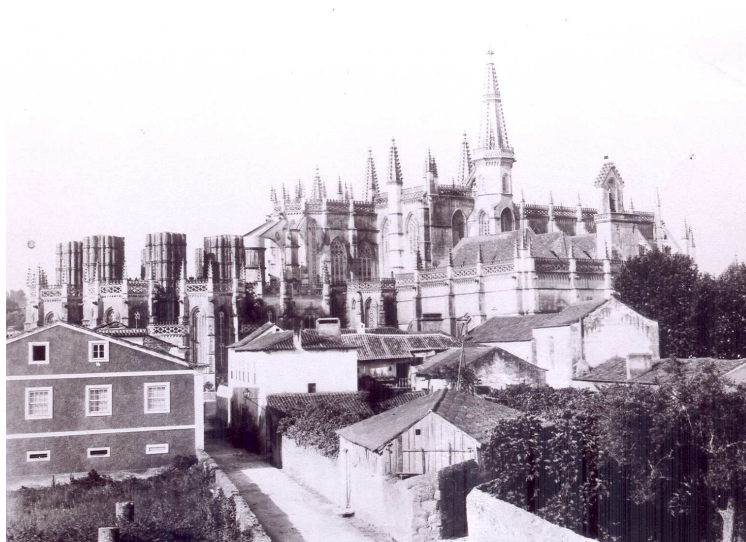
Figura 2. Rua Nossa Senhora do Caminho, lado nascente; observa-se a igreja de Santa Maria a-Velha, princípio do século XX.