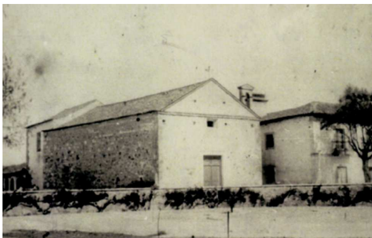
Figura 1. Igreja de Santa Maria-a-Velha, princípios do século XX.