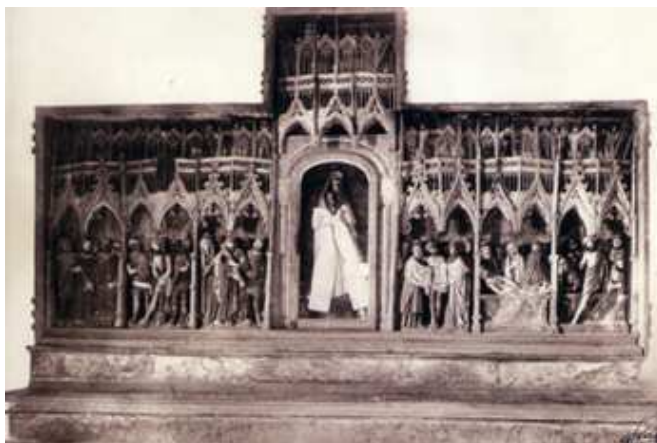
Figura 5. Retábulo da Paixão de Cristo (col. Casa Alvão).