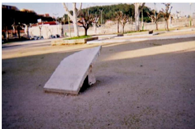
Figura 8. Lápide que foi colocada a assinalar o local da igreja de Santa Maria-a-Velha (col. da autora).