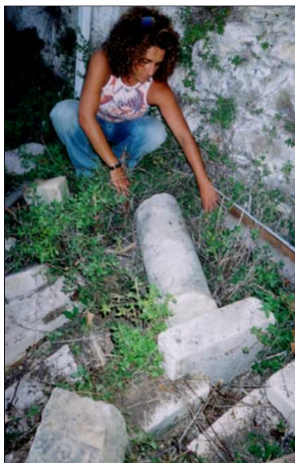
Figura 6. Os fragmentos do retábulo do altar-mor, como os encontramos.