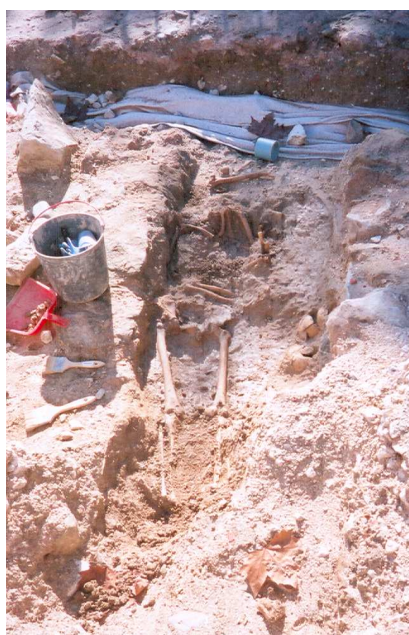
Figura 7. Escavações na área da igreja de Santa Maria-a-Velha.