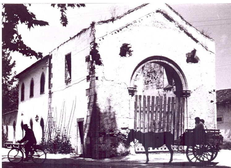
Figura 4. Capela-mor da igreja de Santa Maria-a-Velha, anos 40 do século XX.