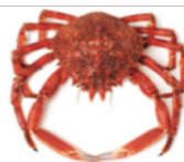
Santola · Spider crab · Centollo