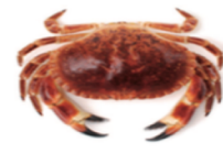
Sapateira · Edible crab · Buey de mar