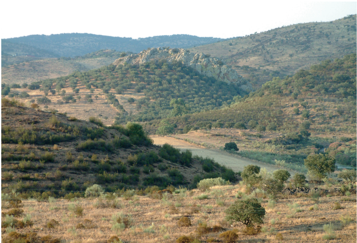
Figura 2 – La Peña de San Sixto.

Algunas veces los pueblos quedaban muy lejos para los desplazamientos oficiales y entonces organizaba excursiones para entrevistarse con las autoridades y eruditos locales en busca de datos. Ése fue el caso de un viaje a Encinasola. Tuvo noticias de la necrópolis romana descubierta en el talud de la carretera hacia La Nava a la altura del paraje de Llano de Burgos (Pérez Macías, 1987, p. 23), y le hablaron del poblado de San Sixto (Fig. 2), en el que se encontraban muchas monedas romanas,