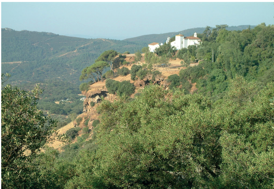
Figura 1 – Travertino de Alájar.