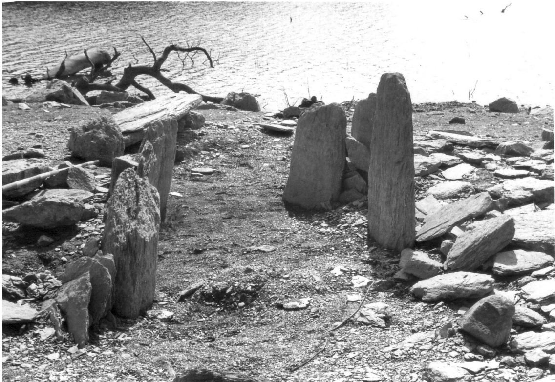
Figura 5 – Dolmen de Monte Acosta (Zufre).

De Zufre también escribe que “hay una docena de cuevas susceptibles de excavación”.