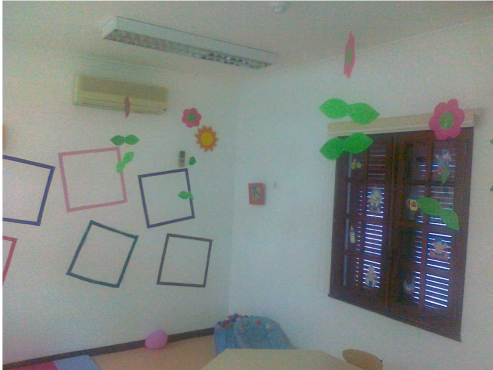
Fotografia 15 – Pormenor da 1.ª fase de construção com destaque para unidade de climatização do tipo Split, armadura de iluminação e vão de janela