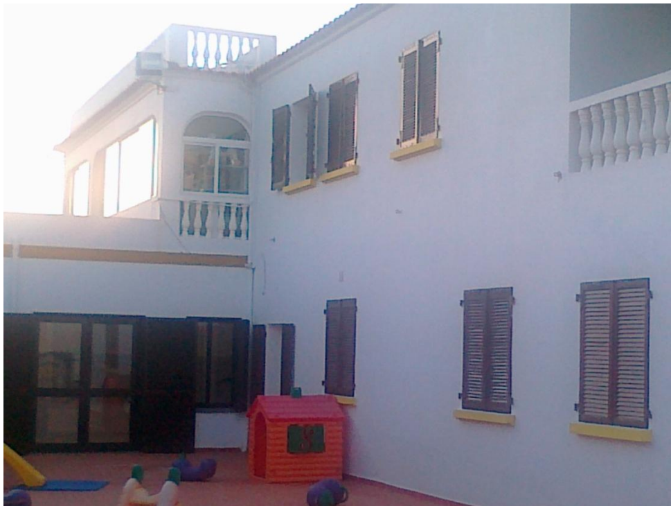
Fotografia 12 – Pormenor da ligação entre a 1. a fase e a 2. a fase de construção (zona de pátio interior)