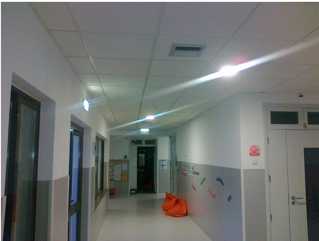
Fotografia 18 – Vista do corredor da 2. a fase de construção