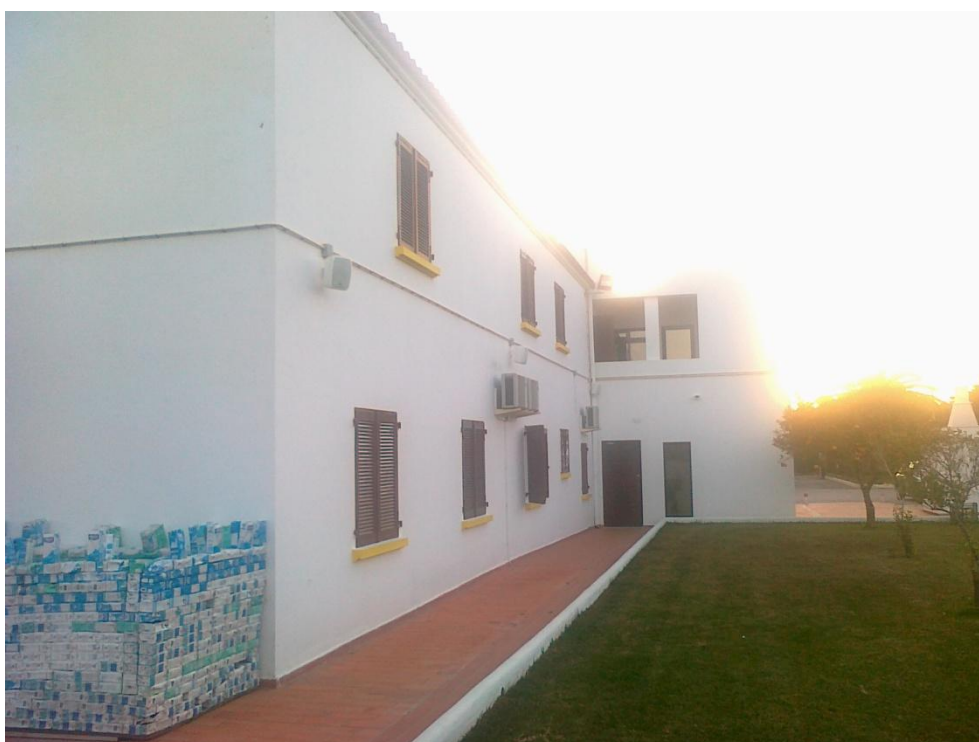
Fotografia 2 – Vista do alçado Norte