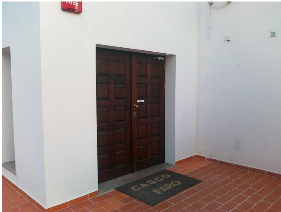
Fotografia 6 – Porta principal de acesso ao edifício