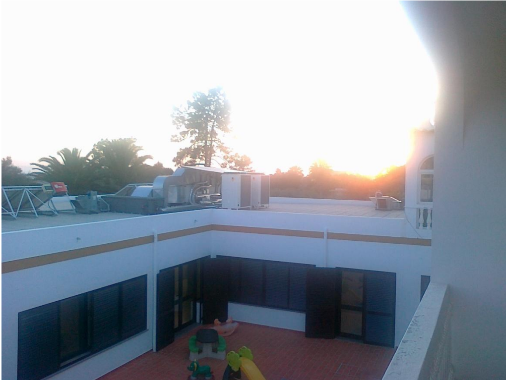
Fotografia 13 – Sistema de climatização da 2. a fase de construção, instalado na cobertura