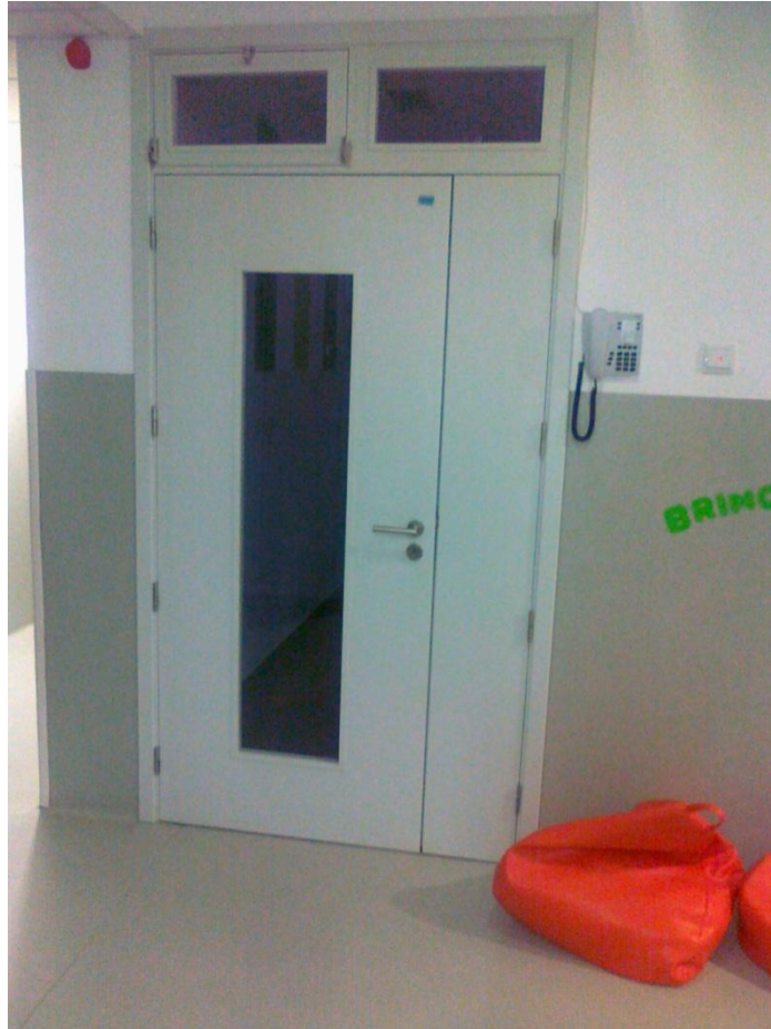
Fotografia 19 – Pormenor de porta interior da 2. a fase de construção