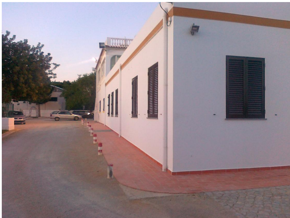
Fotografia 4 – Outra vista do alçado Poente