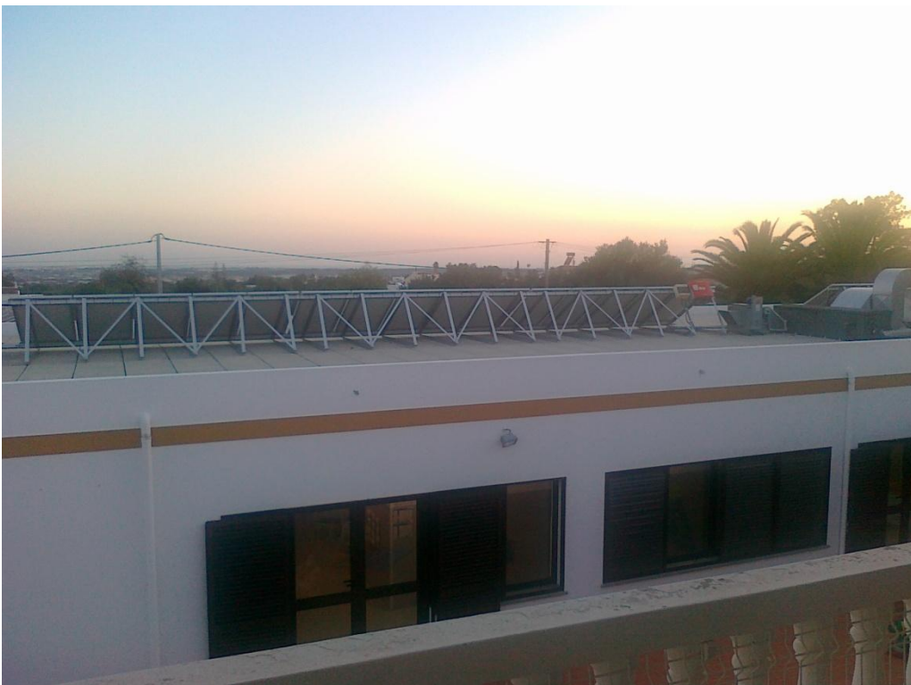
Fotografia 14 – Sistema de microgeração de energia instalado na cobertura da 2. a fase de construção