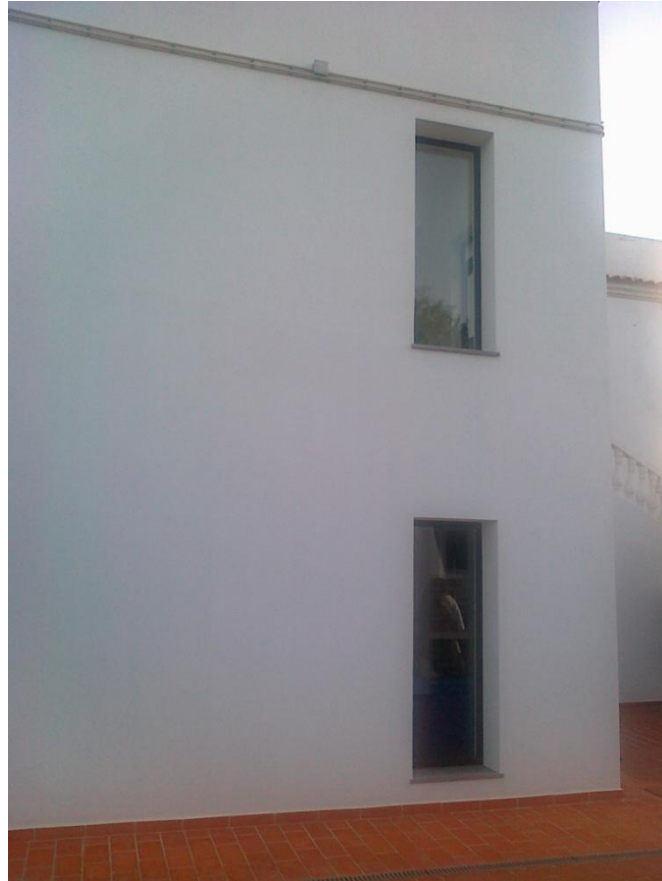
Fotografia 7 – Pormenor de vãos da 2. a fase de construção