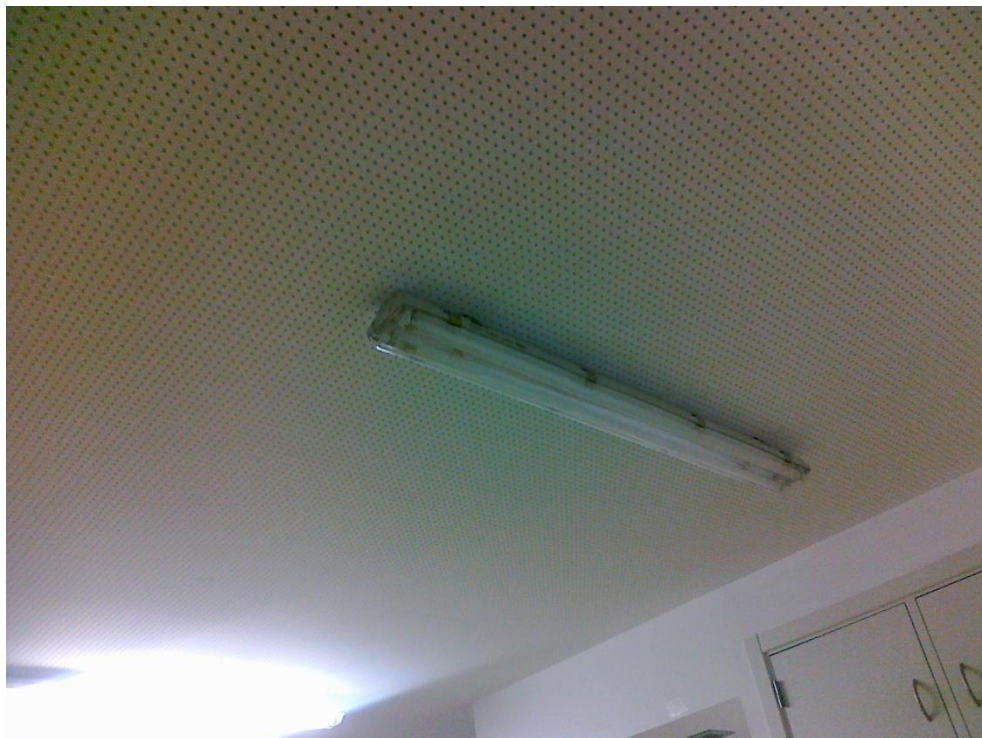
Fotografia 20 – Pormenor de armadura de iluminação aa 2. a fase de construção