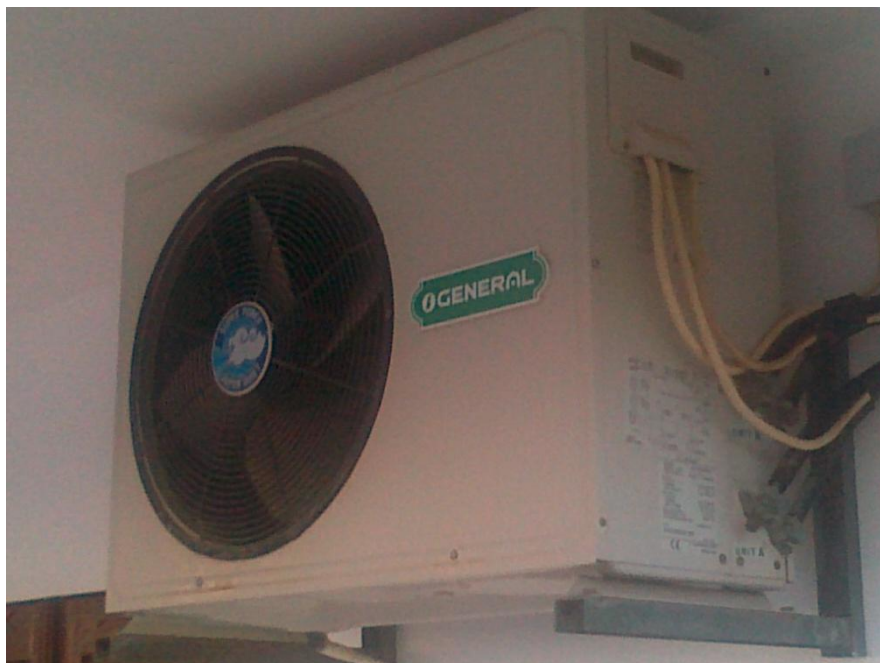
Fotografia 10 – Outro pormenor de equipamento de climatização (multisplit) existente na 1. a fase de construção