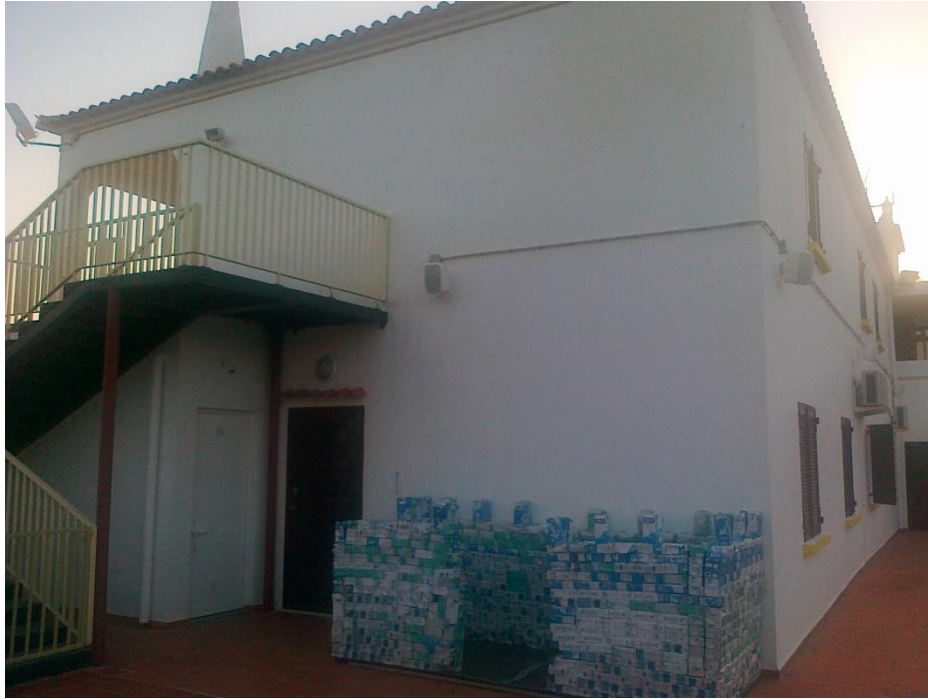
Fotografia 5 – Vista do alçado Nascente (1.ª fase de construção)