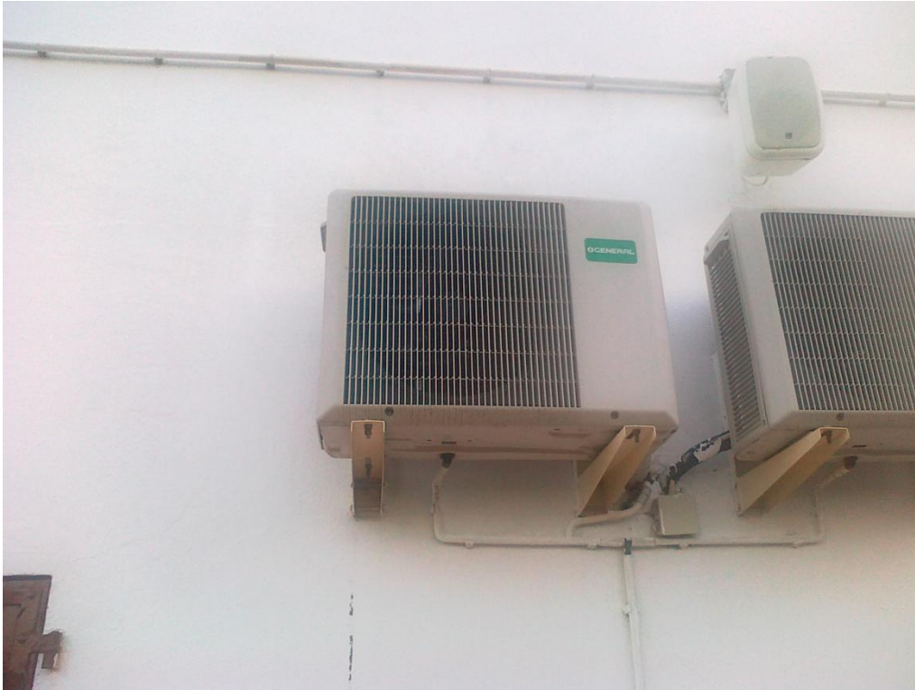
Fotografia 9 – Equipamento de climatização da 1. a fase de construção