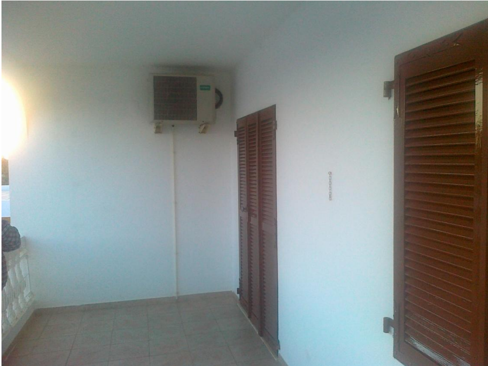
Fotografia 11 – Outro equipamento de climatização existente na 1. a fase de construção (1.º andar fachada Sul)