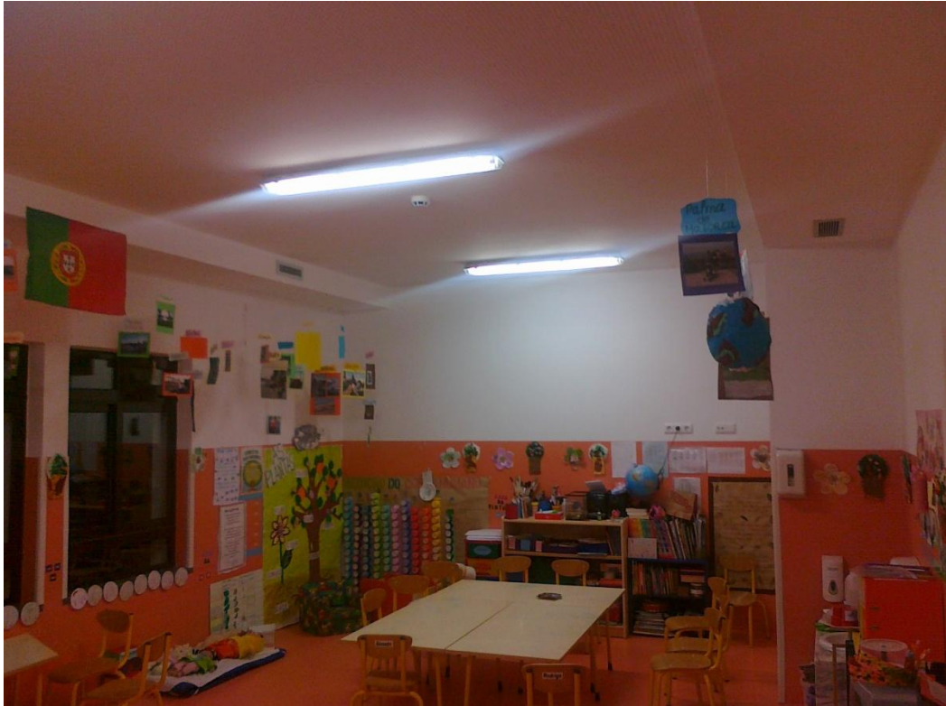
Fotografia 17 – Vista interior de uma sala para crianças acima de 1 ano, na 1. a fase de construção