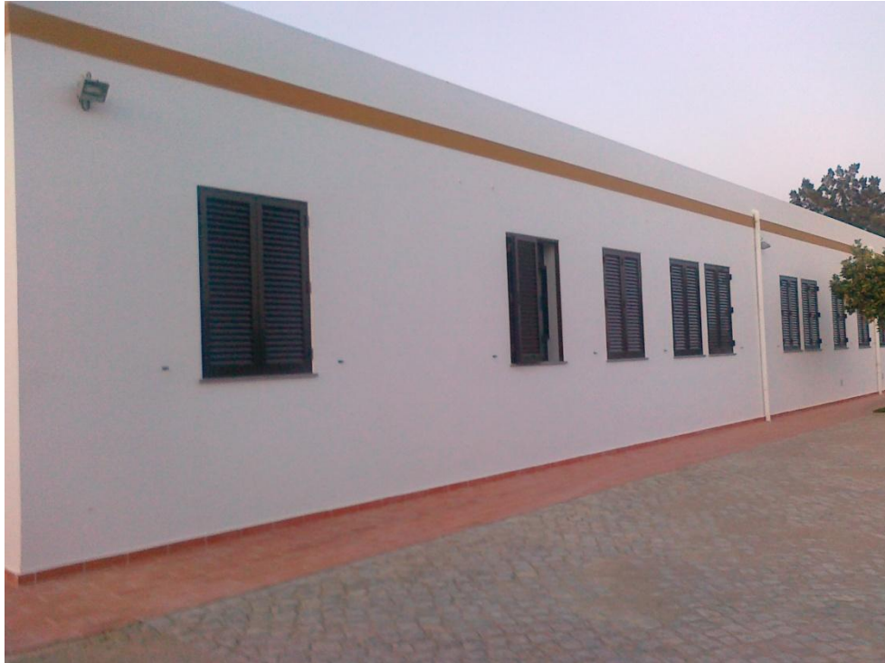
Fotografia 3 – Vista do alçado Sul