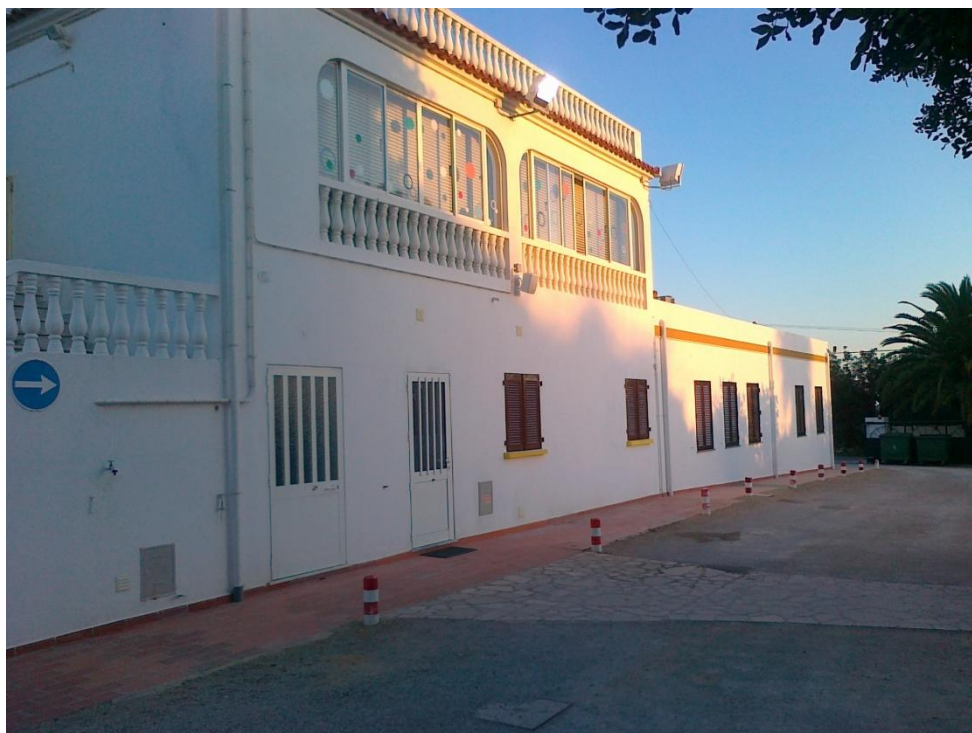
Fotografia 1 – Vista do alçado Poente