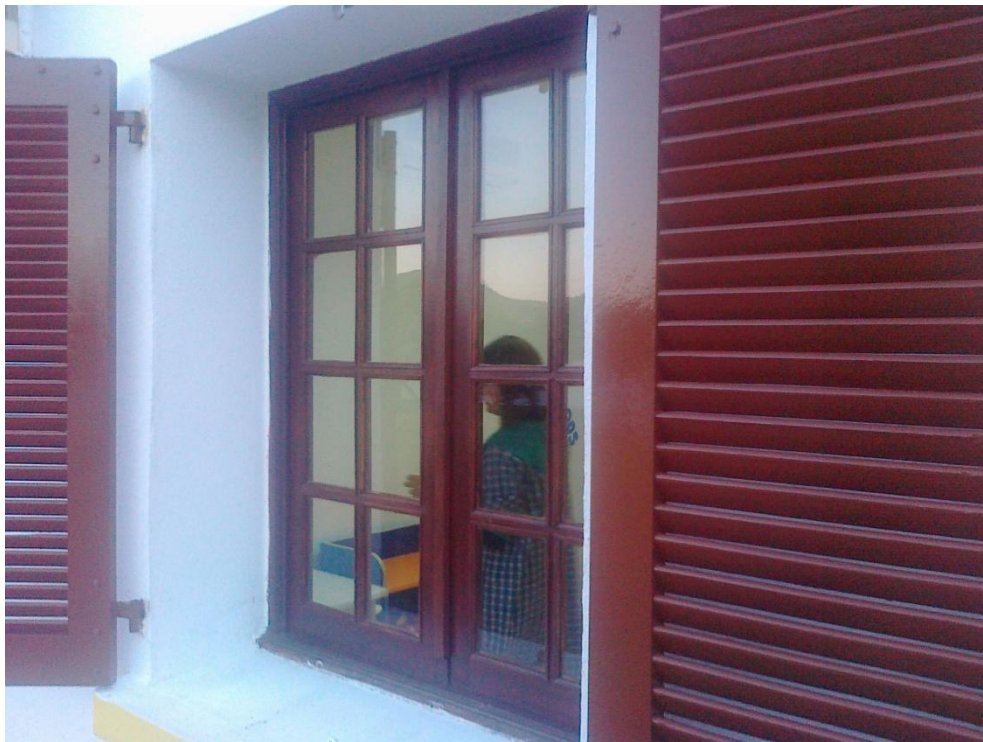
Fotografia 8 – Pormenor de vão de janela da 1. a fase de construção