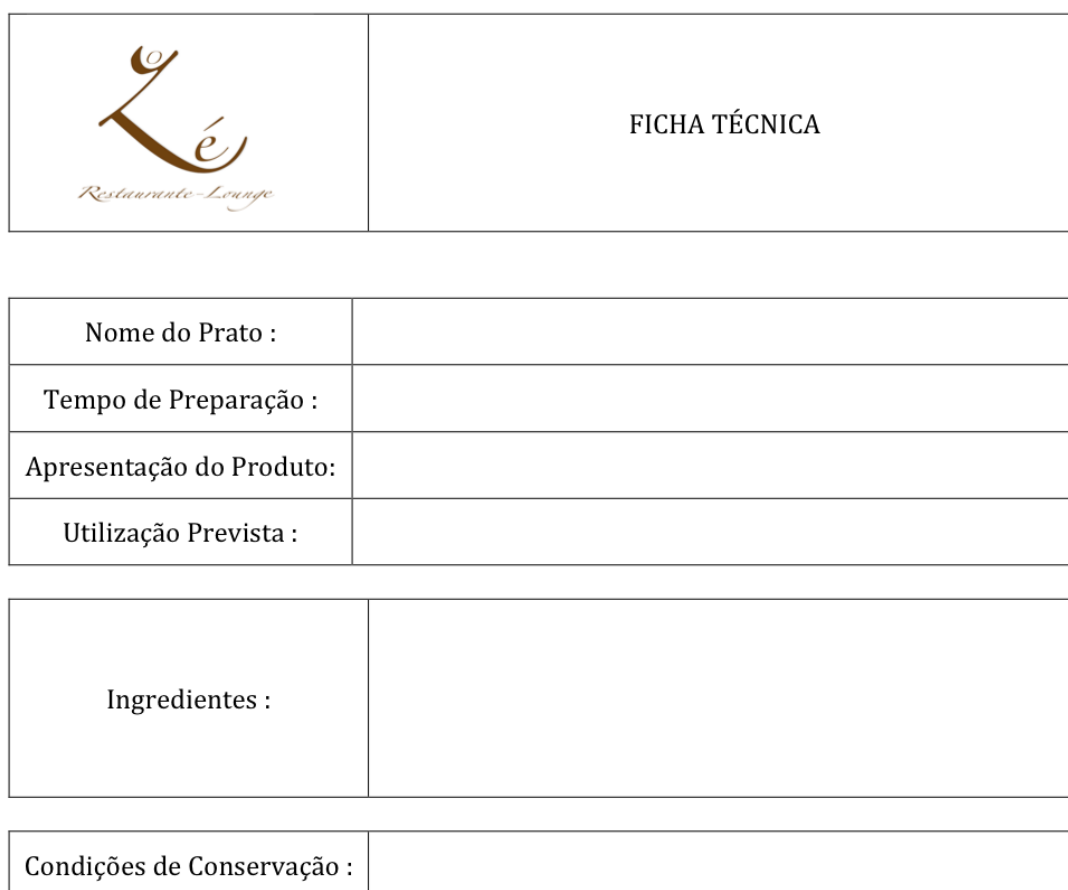
Figura nº 4 – Ficha técnica antes da certificação