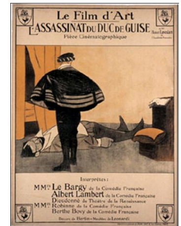
cartaz do filme “L’assassinat du duc de Guise” realizado por André Calmettes em 1908 e com música original do compositor Saint-Saëns

O primeiro programa de Film d’Art foi apresentado em 17 de Novembro de 1908 em Paris e contava com os filmes “O Segredo de Myrto”, “A Impressão” e “O Assassinato do Duque de Guise”