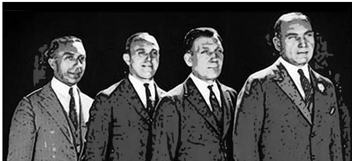
os irmãos Warner: Harry, Jack, Sam e Albert

Nesta época em que o cinema dava os primeiros passos estes elementos foram fundamentais, juntando-se a utilização da música que acompanhava as projecções. Só mais tarde, em 1903 com o filme “Uncle’s Tom Cabin” de Edwin Porter se começaram a usar os intertítulos como complemento das imagens, apesar de muitos dos espectadores serem analfabetos.