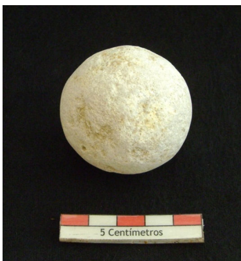
Figura 48 – Projétil de funda.