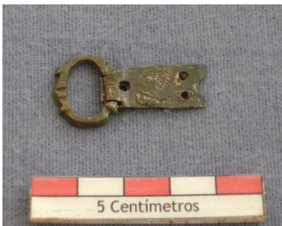
Figura 44 – Fivela em liga de cobre.