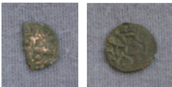
Figura 43 – Dinheiros de D. Sancho II.