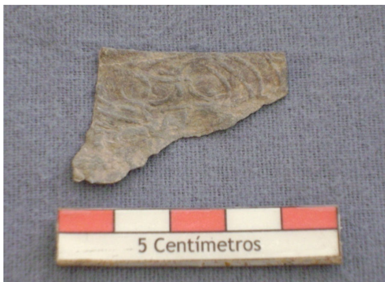
Figura 41 – Placa ornamental em chumbo.