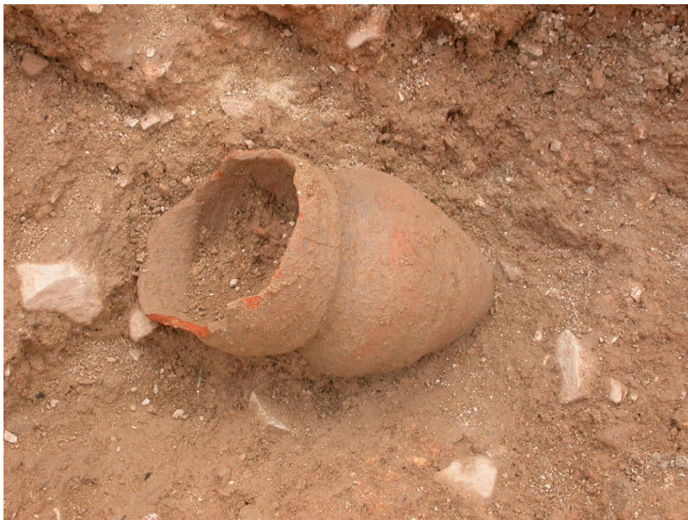
Figura 37 – Pormenor da escavação de um alcastruz.