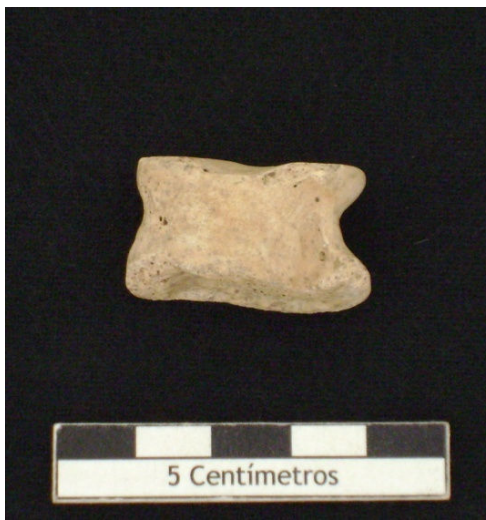
Figura 40 – Astrágalo de ovicaprino.