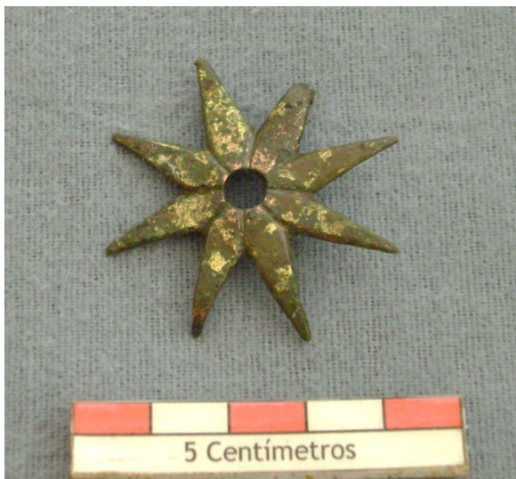
Figura 45 – Ferragem com douramento em forma de estrela ou de flor octopétala.