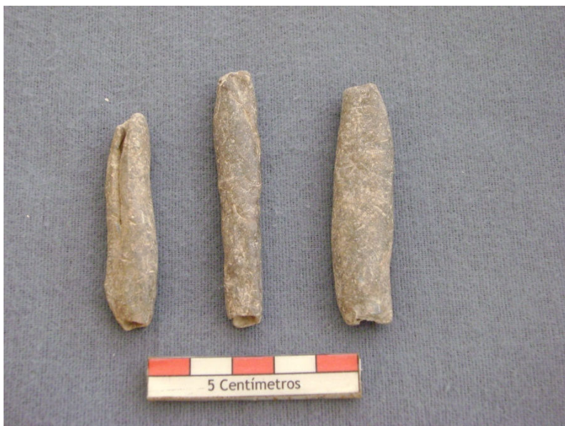
Figura 42 – Pesos de rede em chumbo..