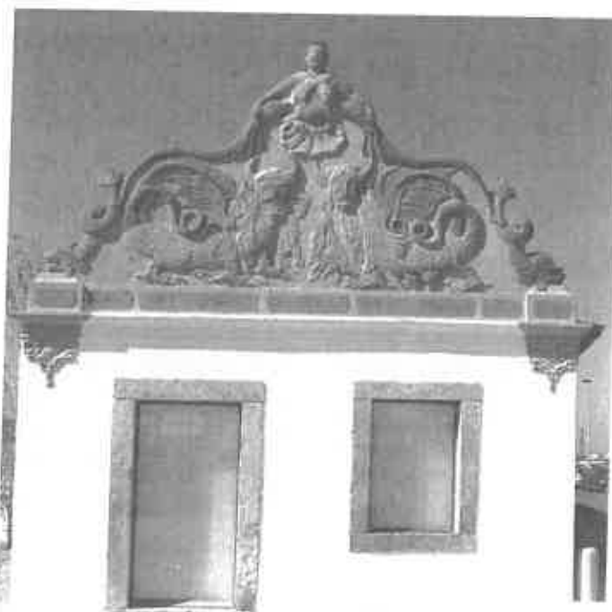
Figura 1 – Casa das Figuras