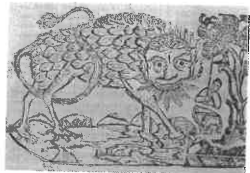
Figura 6 – Representações de monstros na literatura de cordel Monstro de Chaves / Monstro do Chile