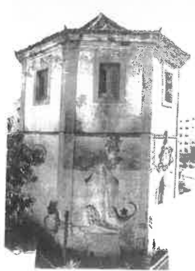
Figura 3 – Torre da Horta dos Cães