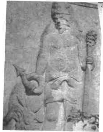
Figura 5 – America, Cesare Ripa / Cabo da Boa Esperança Adamastor, Torre da Horta dos Cães