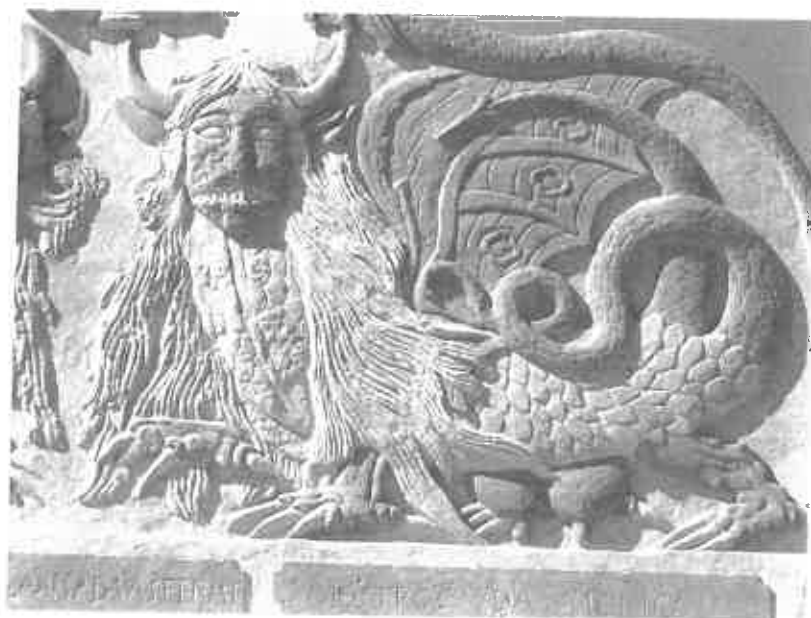
Figura 7 – “Mostros da Merica”