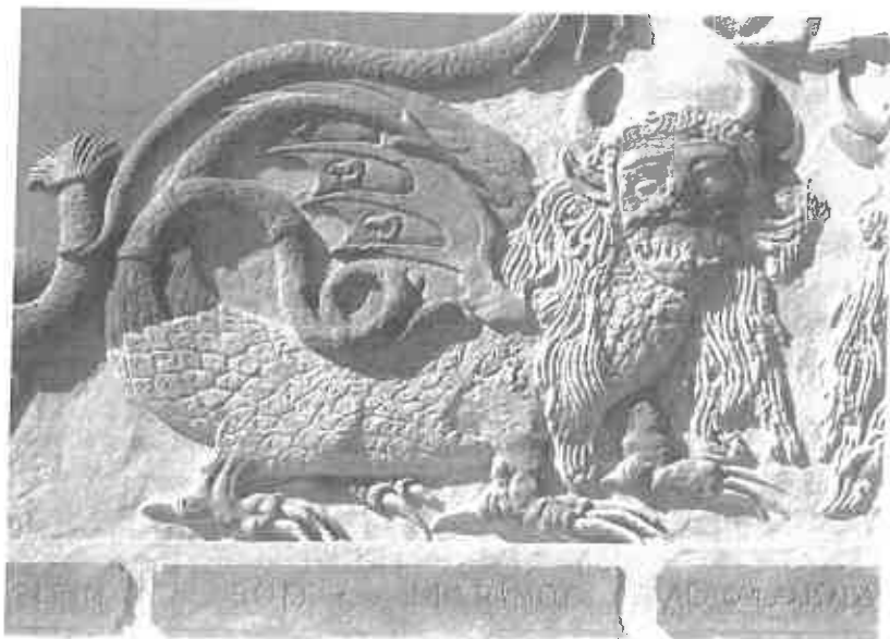
Figura 6 – “Bois Marinos”