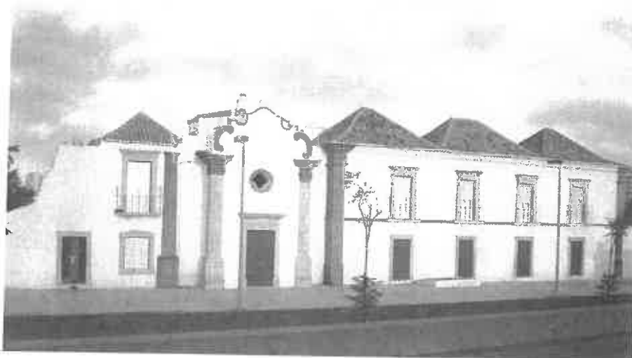
Figura 2 – Horta do Ourives