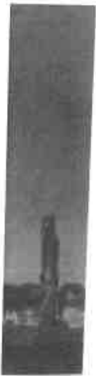
ração de 1969. 3.261.