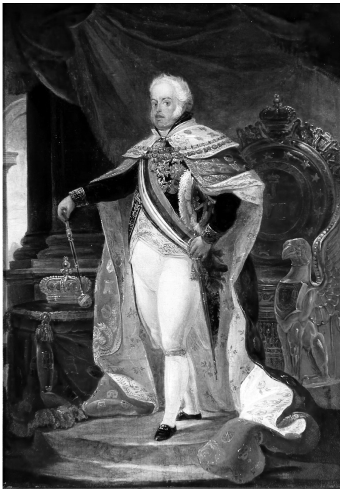
D. João VI, quadro de Jean-Baptiste Debret, óleo sobre tela, 60x42cm, datado de 1817, Escola Nacional de Belas Artes, Brasil

rei de Portugal. 3 Esta figura da Infanta Isabel Maria tem sido descurada pela historiografia do liberalismo, porque nunca tomou partido, sendo injusta a fraca notoriedade que lhe tem sido reservada no tablado da História. 4