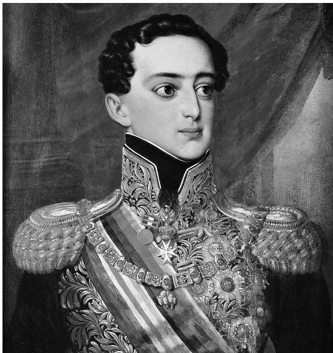
Retrato de D. Miguel pintado em 1827 pelo austríaco Johann Nepomuk Ender (1793-1854) durante o exílio do Infante em Viena.

se por todo o país e na esteira do autoritarismo absolutista, a uma forte repressão contra os seus opositores políticos. Longe de se aproximar da bonomia com que seu pai governou a nação, o infante D. Miguel operou uma política de “caça às bruxas” para exterminar aquilo a que chamou a «hidra liberal». O ódio entre os partidos opositores tornou-se quase insanável, difícil de ultrapassar e esquecer. A principal origem desse exacerbado antagonismo materializara-se na excessiva punição que a coroa miguelista infligira aos adeptos do regime constitucional-parlamentar. A radicalização política que inspirava a facção apostólica conduziu o governo miguelista para o abismo da guerra-civil. E debaixo de um projecto de “purificação” política da família portuguesa se justificaram as maiores atrocidades e perseguições. Procurou-se, nesse espírito selectivo e intransigente, desculpar os bilhostres extorsionários, os minazes caceteiros, bargantes salteadores e sicários de toda a casta, que numa horda de barbárie espalharam o terror branco em defesa do «trono e do altar».