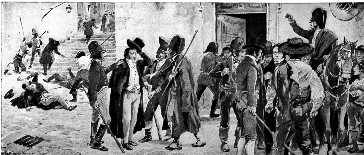
Os caceiteiros miguelistas, representação artística das perseguições populares numa brilhante aguarela do pintor Roque Gameiro.

seus vassallos será sacrificada à vontade do povo. Temos Leis existentes que nos devem dirigir, mas o Povo as posterga. Eis aqui o estado em que se acha a maior parte deste Reino». 27