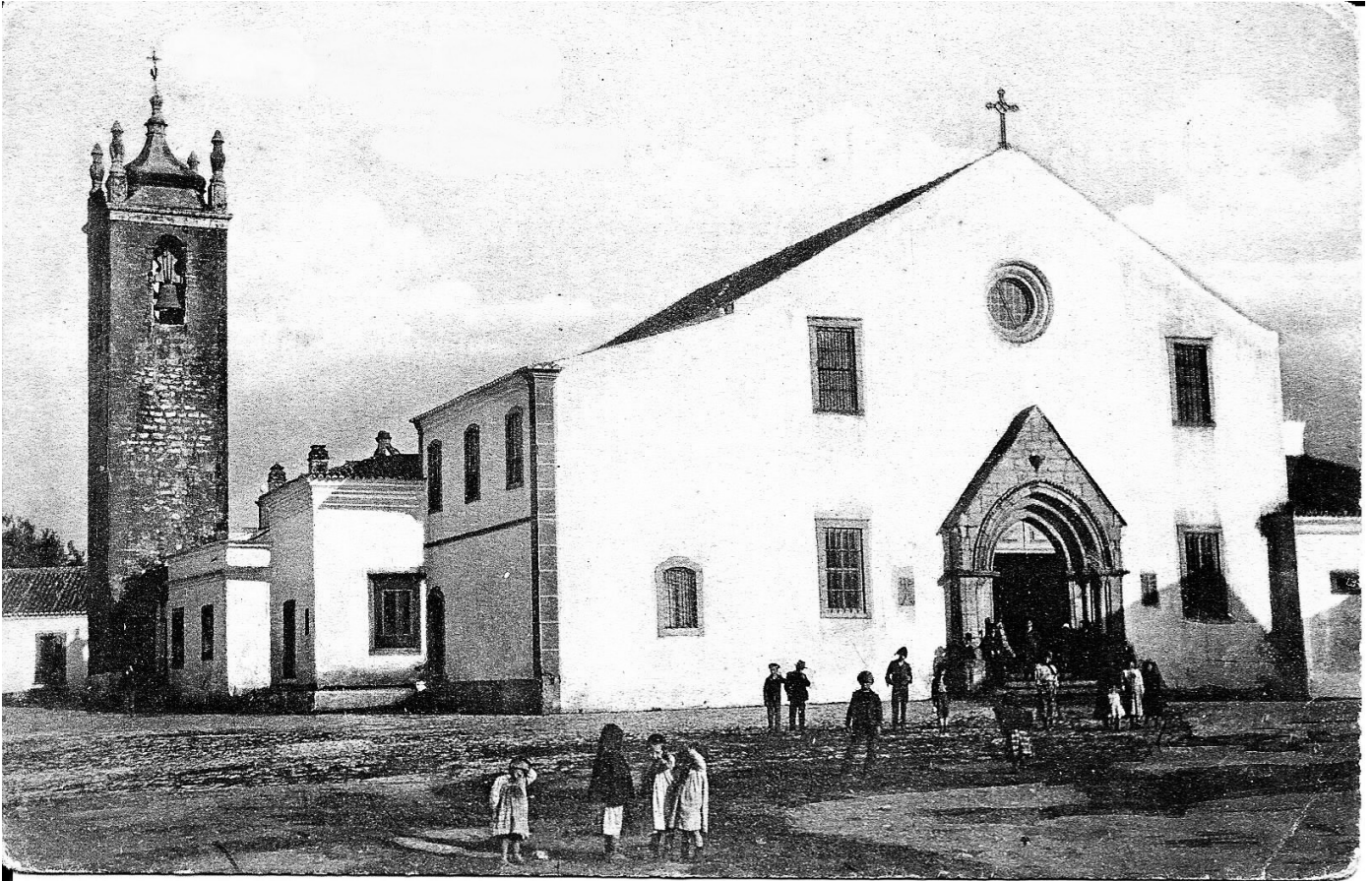
Adro da Igreja Matriz de Loulé, espaço de reunião pública onde celebraram Te-deuns e outras acções de graças, pelas aclamações quer de D. Miguel como de D. Maria II.

com o espaço geo-económico algarvio. Em todo o caso, importa realçar que 40 dos revolucionários implicados nas devassas não eram algarvios, pertencendo na sua maioria ao sector terciário. Também não deixa de ser curioso notar que 24 pronunciados, ou seja 6%, eram de origem estrangeira, maioritariamente espanhóis, a par de alguns brasileiros e ingleses.