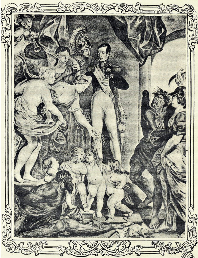
Estampa alegórica à entronização de D. Miguel I, cognominado pelo povo como «O Anjo Absoluto»

existiam verdadeiramente. E nos meses que se seguiram à “Revolta do Algarve”, em 25 de Maio de 1828, as autoridades instituídas pagaram caro a irresponsável ousadia de haver distribuído armas pelo «povo», como se toda a caterva de desocupados, «rotos e famintos» fosse capaz de se submeter, se não pela força, a qualquer tipo de bandeira.