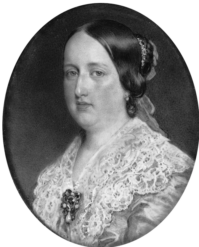
Retrato em miniatura para uso privado, da rainha D. Maria II, por William Charles Ross, 1852

Assim que D. Miguel retornou à pátria, o partido absolutista apoderou-se das rédeas do poder, substituindo o governo pelos fiéis áulicos do Infante, encetando-se de seguida um dilatado saneamento político e militar. Um dos mais eficazes prosélitos desta espécie de «viradeira» (mais feroz e sectária do que a que caracterizou a governação pós-pombalina) foi o ministro da guerra, Conde do Rio Pardo, que o vulgo cognominaria de «Conde Leopardo» 5 , por ser o obreiro da depuração a que se procedeu no seio das chefias militares. Assim, os Comandantes das Armas, oficiais dos regimentos e quartéis desafectos ao absolutismo foram as primeiras vítimas da «purga»