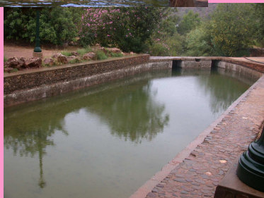
Piscina da Fonte Grande