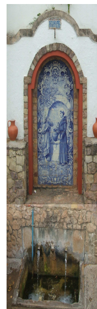
Bica da Fonte Pequena