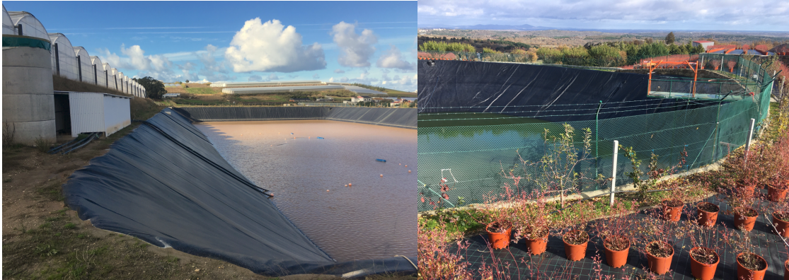
Figura 3 – Recolha de drenagem e águas pluviais para a rega de culturas hortícolas em estufa e de pequenos frutos ao ar livre, na região do Oeste (à esq.) e na Guarda (à dir.) (fotos de M. Reis).