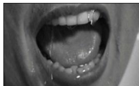
"Psycho", 1960 Alfred Hitchcock EUA