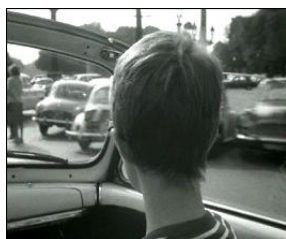
"O Acossado", 1959 Jean-Luc Godard França