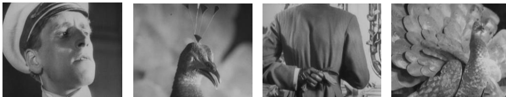
Dois exemplos da montagem de Eisenstein “A greve” 1924 – O massacre dos grevistas é associado ao degolar de bovinos no matadouro. “Outubro 1917” 1927 – A pose autoritária do odiado primeiro-ministro Alexandre Kerenski é montada em paralelo com um pavão.

Mas Griffith não desenvolveu apenas a montagem narrativa, como foi o impulsionador da montagem expressiva . Começou por explorar a montagem alternada nos finais das suas curtas-metragens para a Biograph, para acentuar a emoção do público, justapondo duas (ou várias) acções que decorrem ao mesmo tempo mas em espaços diferentes, e que no fim podem confluir no mesmo espaço (ex: a sequência final do episódio “A Mãe e a lei” de “Intolerância, 1916). Desenvolveu então a montagem paralela que, apesar de também justapor acções alternadamente, não tem uma função narrativa pois não se centra na questão temporal. Pretende-se que o espectador estabeleça uma relação simbólica do confronto das situações a partir da sua comparação ou contraste. (os 4 episódios de Intolerância)