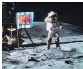
Genérico do canal temático MTV