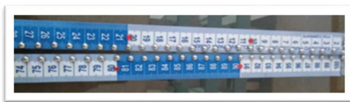
Figura 3.2. Fita métrica adaptada para o aluno cego