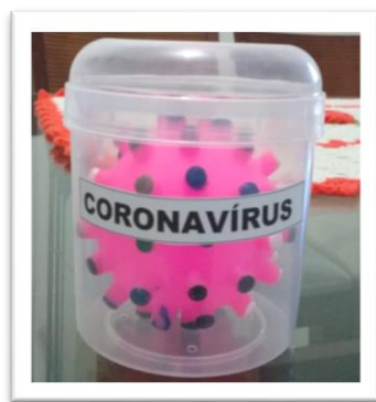
Figura 3.1. Representação do Coronavírus

A professora Bia, no momento da entrevista compartilhou alguns materiais confeccionados por ela e pelo professor de atendimento educacional especializado (ver Figuras 3.1 e 3.2 e Apêndice IV), voltados para as necessidades apresentados pelo aluno durante o desenvolvimento das aulas.