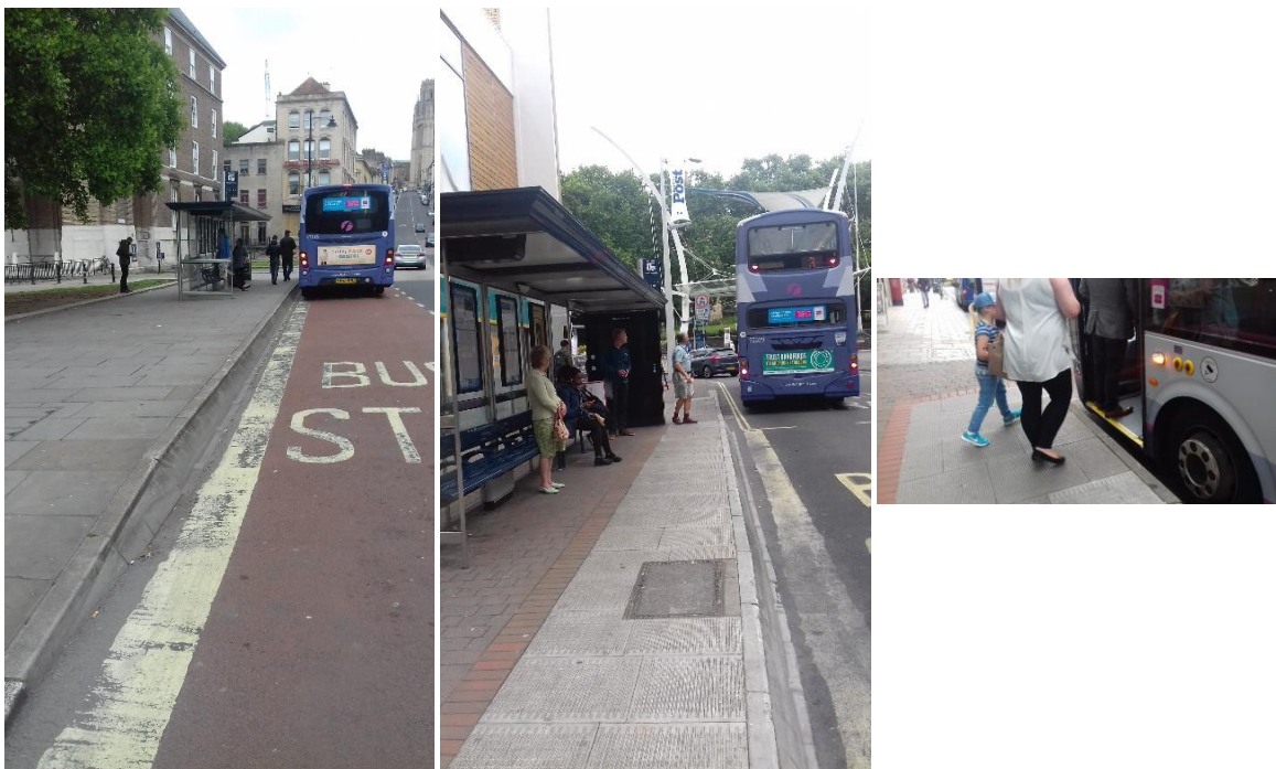
Figura 3. Paragem de autocarro inclusiva em Bristol

Na Figura 3 apresenta-se uma paragem de autocarros acessível, localizada em Bristol. A paragem de autocarros é sobreelevada, o pavimento tem faixas com diferenciação cromática, o abrigo é amplo e tem bancos individuais com braços e encosto.