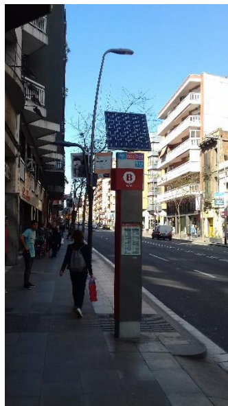
Figura 2. Pavimentos táteis direcionais em paragens de autocarros em Barcelona Os caracteres de identificação da linha de autocarros têm uma altura mínima de 14 centímetros e contrastam com a superfície na qual se registam.

Os postaletes terão informações sobre identificação e denominação da linha no sistema Braille.