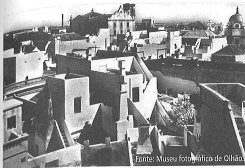
Figura 2 | Olhão - Açoteias e mirantes.

que, como assinalam Pender e Sharpley (2004: 171), se transformaram em espaços que se replicam, monótonos e indiferenciados.