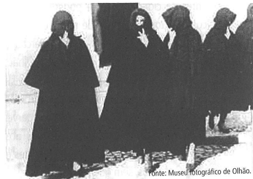
Figura 3 | Mulheres de bioco.

Como seria de esperar, grande parte do texto assenta na descrição de espaços e atividades ligados à pesca. Fundamental, o mar é amplamente referido, mais do ponto de vista do pescador do que do turista. Assim, alude-se à Ria Formosa, à barra, às ilhas barreira e ao farol: "Para lá da água empoçada ficam os areais, a ilha da Armona, a do Levante, a ilha da Culatra e o farol de Santa Maria" (Brandão, 1923: 161). Menções que remetem para passeios que já estão implementados, mas não, como poderiam, em réplicas das tradicionais embarcações de pesca (que