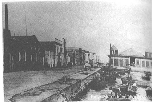
Figura 4 | Avenida 5 de Outubro com vista para a Mercado do Peixe.

Retomamos a questão do cais e a descrição da chegada do peixe, dada a centralidade que ocupam na obra e na vida dos olhanenses: