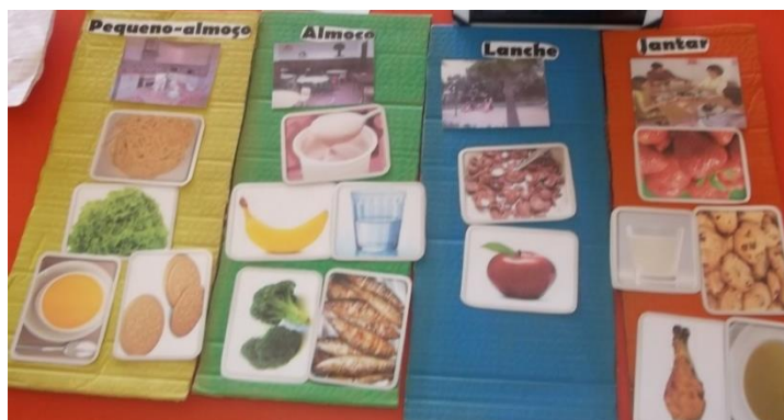
Figura 1. 7 - Jogo de associação: alimentos vs refeições.

os diferentes tipos de alimentos e os diferentes tipos de refeições (Figura 1.6). Pretendia-se, também, explorar a noção que tinham da importância a atribuir a cada alimento.