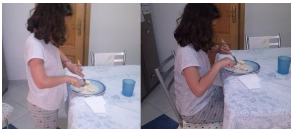
Figura 1. 13 - Imagens sobre a maneira desadequada e adequada de estar à mesa.