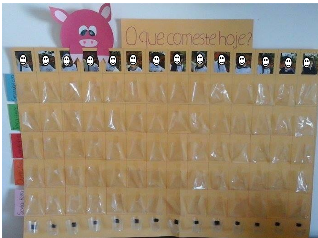
Figura 1. 11 - O Mapa da refeição colocado no refeitório.

O Mapa da refeição foi a estratégia que se seguiu e que foi integrada na rotina das crianças. Recorremos à personagem do «Camilão», que já era conhecida das crianças, como porta-voz do Mapa da refeição . O Mapa da refeição consistia num painel, colocado no refeitório, que tinha as fotografias de todas as crianças colocadas na primeira linha, na horizontal, e que tinha, por baixo de cada fotografia, na vertical, 5 bolsas de plástico (figura 1.10). As crianças tinham, à sua disposição, cartões com a imagem do tipo de alimentos (peixe, carne, fruta, hortícolas, sopa, batata/massa, água; Apêndice 12), que integravam a refeição, devendo colocar nas bolsas, os cartões correspondentes ao tipo de alimento que tinham ingerido ao almoço. Esta rotina decorreu durante duas semanas, após a hora do almoço.