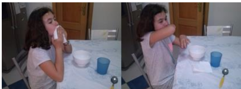
Figura 1. 5 - Exemplo de imagens utilizadas no instrumento.

A história tinha como personagem uma menina chamada Maria, que tinha comportamentos diversificados à mesa e que nunca sabia quando estava a agir corretamente ou não. No decorrer da narrativa, as crianças participavam na história, uma vez que lhes era solicitado que escolhessem a imagem que correspondia ao comportamento que a Maria devia ter. As crianças tinham à sua disposição duas imagens (figura 1.4), representativas da mesma situação, mas com manifestação de comportamentos diferentes em cada uma delas. Era solicitado às crianças que justificassem a sua opção, ficando-se, desta forma, a conhecer as ideias (concepções) que tinham acerca do assunto. As imagens utilizadas podem ser consultadas no Apêndice 6.