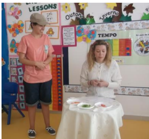
Figura 1. 9 - Dramatização: «Carlos» e «Lola».

Na dramatização (figura 1.8) levámos, desta vez, as personagens «Carlos» e «Lola» à sala de atividades. A história falava sobre uma menina, Lola, que não gostava de alguns alimentos que eram importantes para a sua saúde, especialmente o tomate. O enredo integra o irmão mais velho, Carlos, que junta uma dose de imaginação a cada alimento, para tentar que a sua irmã coma.