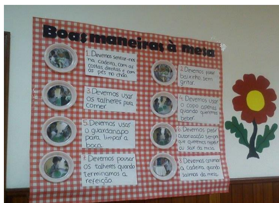
Figura 1. 8 - Painel das boas maneiras à mesa, exposto no refeitório.

Como o painel das boas maneiras à mesa iria ficar exposto no refeitório (figura 1.7), sentimos necessidade de apresentar as regras, que, no fundo, foram construídas pelas crianças, a todas as outras salas do jardim de infância, uma vez que o refeitório é partilhado por todos.