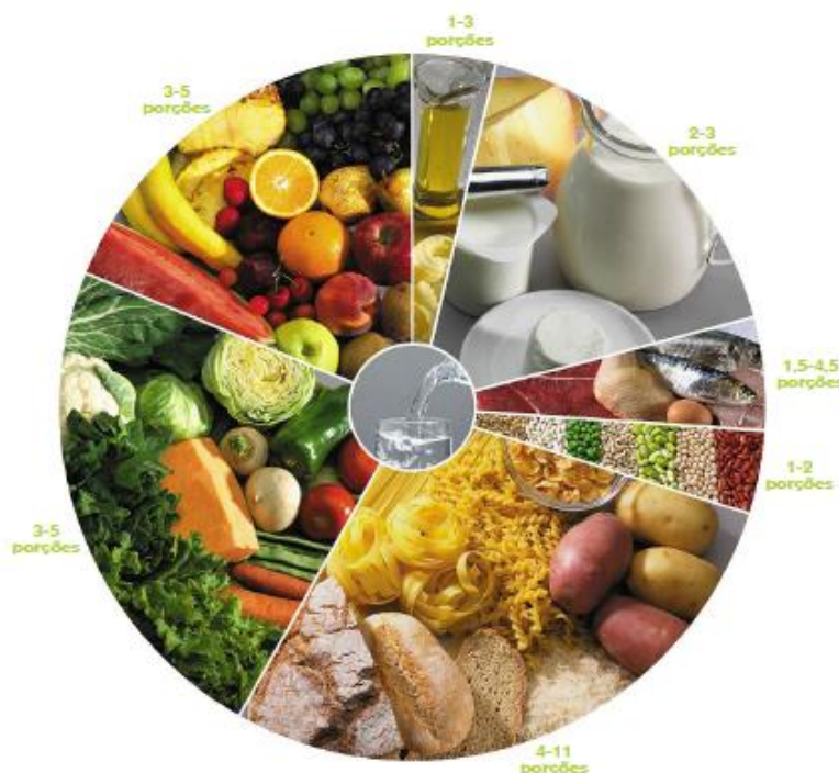
Figura 1. 1 – A roda dos alimentos portuguesa (Instituto do Consumidor, 2003).

No fundo, pretende-se que os indivíduos mantenham uma alimentação equilibrada (Nunes e Breda, 2001).