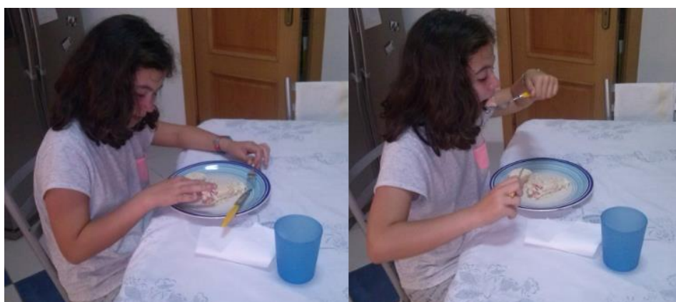
Figura 1. 14 - Imagens sobre a maneira desadequada e adequada de comer.

Na figura 1.11 vemos a personagem a utilizar o copo de duas maneiras diferentes. A criança «F» ao olhar para estas imagens considerou que naquela em que a personagem tinha a mão dentro do copo, estava a agir corretamente, dando como justificação que a mesma estava sentada. A criança acabou por dar mais importância a esse pormenor, não percebendo o que estava de errado na imagem. Em contrapartida, em relação à imagem em que a personagem pega no copo com as duas mãos para beber, a criança considerou o comportamento errado porque, segundo as suas palavras, ela não estava a comer.