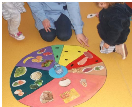
Figura 1. 4 - Construção da roda dos alimentos.

No início da prática de ensino supervisionada explorámos a Roda dos alimentos , falando dos alimentos que a constituem e da forma como estão agrupados. Embora não fizesse parte das estratégias de intervenção educativa, a construção desta maquete (figura 1.3) foi importante porque passou a ser parte integrante do cenário da sala de atividades, permitindo-nos recorrer ao conteúdo da Roda dos alimentos , sempre que necessitávamos.