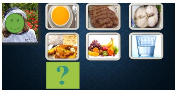
Figura 1. 15 - Exemplar da apresentação de Power point.

Como referimos na metodologia, nos dia 2 e 9 de junho reunimo-nos na sala de atividades e, com recurso a uma apresentação de Power point (figura 1.14), fizemos um balanço daquilo que cada criança comeu e rejeitou ao longo de cada semana. Este balanço foi feito através do diálogo com as crianças, tendo elas próprias a oportunidade de perceber aquilo que comeram e rejeitaram nessas semanas.