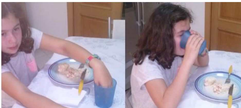
Figura 1. 12 - Imagens sobre a maneira desadequada e adequada de utilizar o copo.