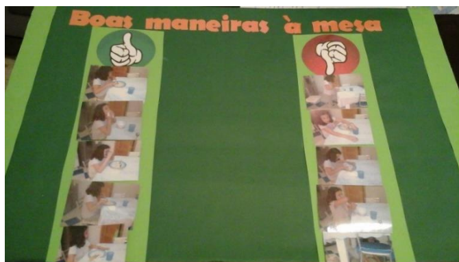
Figura 1. 6 - Painel com imagens representativas da prática de boas maneiras à mesa.

As imagens que representavam os bons e os maus comportamentos da Maria à mesa foram colocados num painel para ajudar as crianças a manter estas imagens na memória (figura 1.5).