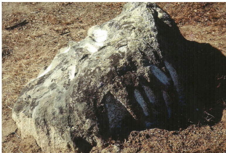
FIG. 7 – Rocha insculturada com podomorfos da Herdade da Capela.