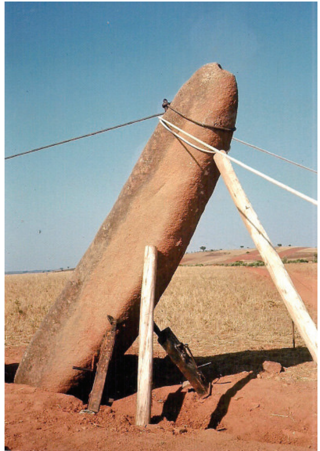
FIGS. 3 e 4 – Menir fálico do Outeiro aquando do seu erguimento do solo (em cima) e menir insculturado de Belhóa ou Bulhóa (à direita).