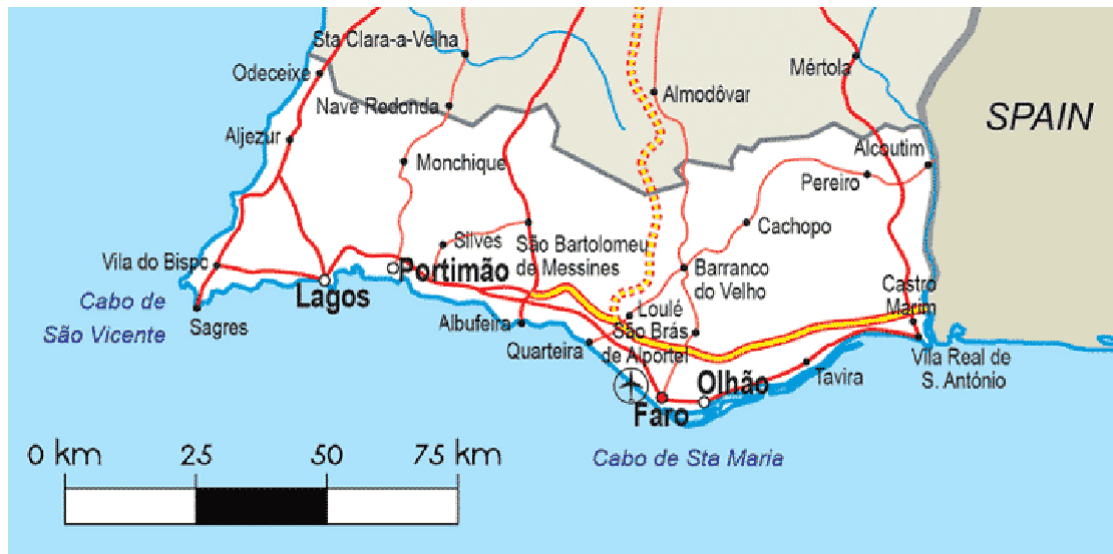
Figura 3.1 Mapa do Algarve