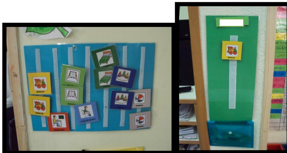
Figura 6 – Horário

Na sala existia ainda um horário onde estava o cartão respetivo à área a que se pretendia que a criança fosse. Assim, era-lhe entregue pelo adulto, um cartão com o seu nome, cartão esse com o nome de cartão de transição. Ao receber esse cartão de transição a criança teria de se deslocar ao horário, ver qual a área pretendida e recolher o cartão correspondente à área. Quando chegasse à área escolhida teria um envelope onde colocava a imagem.