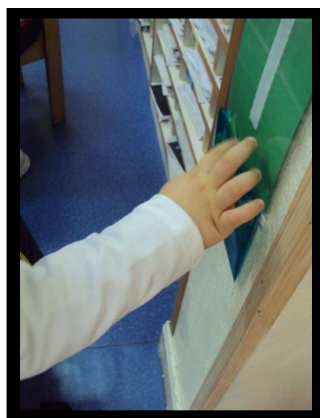
Figura 7 - Criança a colocar o cartão

A utilização do método aqui mencionado foi muito importante para a aquisição de alguns comportamentos simples por parte do P. que, até ao momento, se encontravam sopitados, assim como o aumento da concentração e a estruturação do dia do P. na escola.