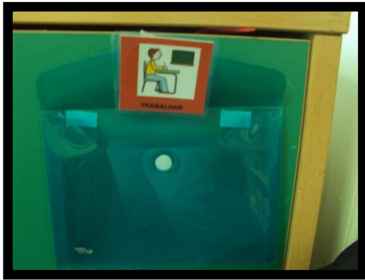
Figura 3 - Área do trabalhar