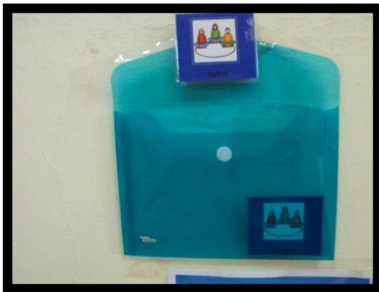
Figura 5 - Área do tapete

Na sala existia ainda um horário onde estava o cartão respetivo à área a que se pretendia que a criança fosse. Assim, era-lhe entregue pelo adulto, um cartão com o seu nome, cartão esse com o nome de cartão de transição. Ao receber esse cartão de transição a criança teria de se deslocar ao horário, ver qual a área pretendida e recolher o cartão correspondente à área. Quando chegasse à área escolhida teria um envelope onde colocava a imagem.