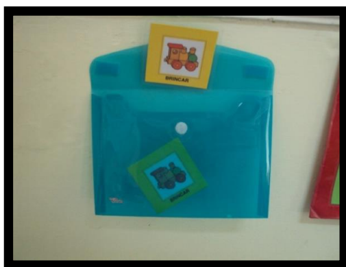
Figura 1 - Área do brincar

Para que a criança crie uma rotina e comece a utilizar o espaço em seu redor de forma útil e não apenas como um espaço para correr, como anteriormente acontecia, foi necessário colocar na sala e nos espaços envolventes, vários envelopes com uma imagem do que é pretendido que a criança faça, criando assim várias áreas. Nas imagens que se seguem são apresentados todos os espaços existentes na sala e fora desta.