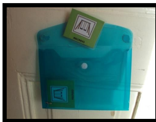
Figura 2 - Área do recreio