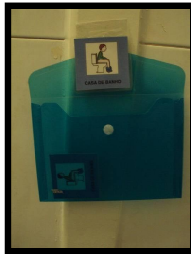
Figura 4 - Área da casa de banho