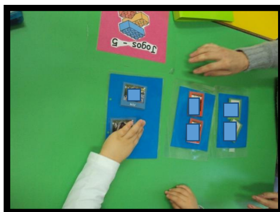
Figura 8 - Atividade igualar as fotos da família

Para a realização desta atividade é pedido à criança que se dirija ao horário, entregando-lhe um cartão de transição. Ao chegar ao horário a criança encontra a imagem do “trabalhar”. O P. já sabe que tem que se dirigir para a mesa de trabalho. Senta-se e encontra lá os materiais com os quais irá realizar a atividade, neste caso dois cartões de cada uma das fotografias (pai, mãe e criança).