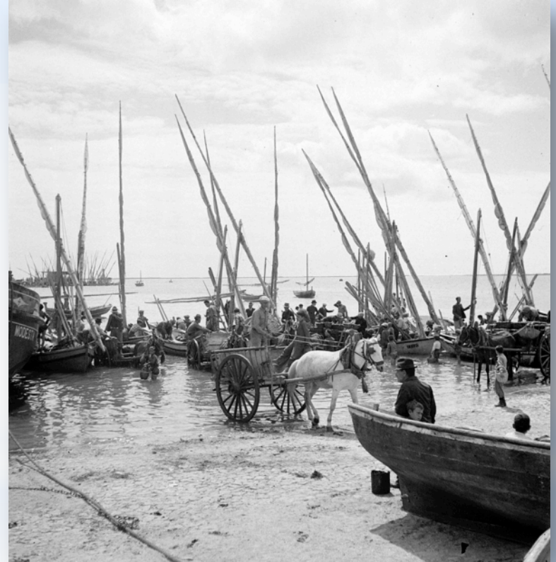
Fotografias de Artur Pastor: Lagos e Olhão, anos 50 a 60