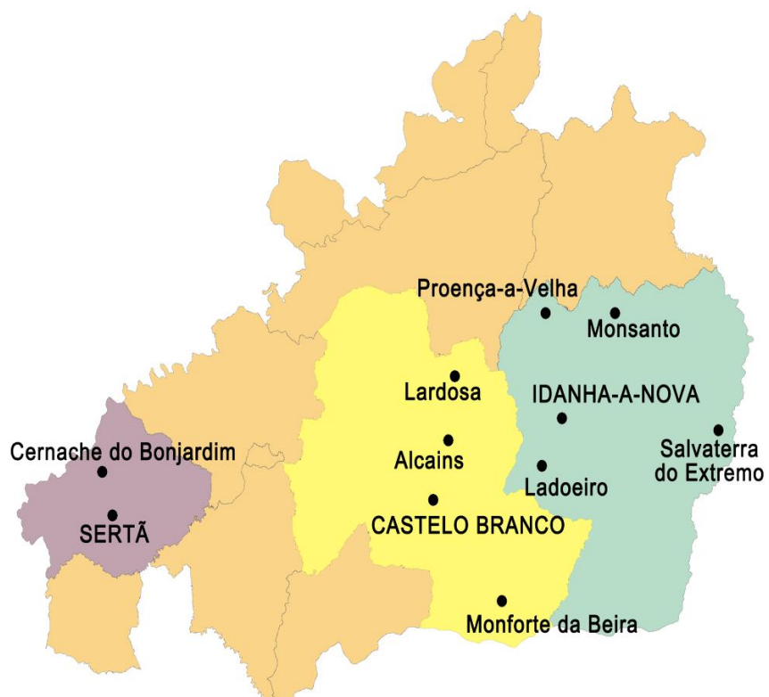
Figura 2 - Mapa de pormenor