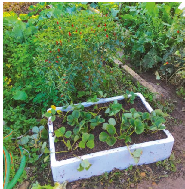
Figura 1 . Morangueiros cultivados numa caixa com uma mistura do solo local e um composto de resíduos vegetais, homologado para o modo de produção biológico (MPB), numa horta comunitária conduzida em MPB, evidenciando a percepção popular de que tão biológico será a planta com as suas raízes no solo in situ , como na mistura (substrato...) na caixa.

Enquanto o legislador enfatiza a obrigatoriedade de o cultivo ser no solo, os consumidores parecem valorizar sobretudo o facto de não serem usados produtos químicos de síntese na sua produção (Raviv & Lieth, 2008; Shanker, sd) e o impacto global da forma de cultivar (Figura 1), o que se traduziu no desenvolvimento de diferentes processos de certificação (e.g.: Global GAP).