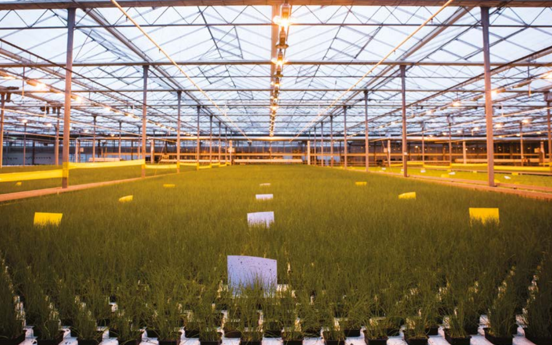
Figura 4 . Otimização das condições ambientais de cultivo com recurso a iluminação artificial (Foto: Aromáticas Vivas Lda).

Importa deixar claro que o conhecimento atual não demonstra que o cultivo no solo, biológico ou não, permita obter - sempre - produtos da melhor qualidade (o que quer que isso designe...), com menor impacto ambiental e de forma mais económica do que os cultivados fora do solo (Rosa et al. 1995; Reis, et al., 2005; Juroszek, et al. 2009; Gruda, 2009; Rembiałkowska et al., 2012; Clark & Tilman, 2017; Müller & Sukhdev, 2018). Isto é, embora o cultivo no solo possa ser, de um ponto de vista filosófico, a forma de cultivo mais natural, por procurar integrar o processo de produção agrícola no funcionamento dos ecossistemas, não se pode ignorar que se consegue cultivar sem recorrer ao solo (Figura 4), em condições técnicas idênticas às seguidas no solo, em que as plantas podem desenvolver as suas raízes num meio poroso, rico em matéria orgânica, vivo, e onde podem ocorrer os mesmos mecanismos de interação positiva entre plantas e microorganismos de solo, mas com significativas vantagens técnicas, económicas e sociais (Grafiadellis et al., 2000; Engindeniz, 2004; Mato, 2004; Engindeniz & Ayse, 2009; Svensson, 2016). Por isso se desenvolveram tão diversos e importantes sistemas de cultivo sem solo, nomeadamente de hortícolas e de flores (Urrestarazu, 2004, Raviv & Lieth, 2008) .