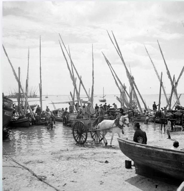
Fotografias de Artur Pastor: Lagos e Olhão, anos 50 a 60