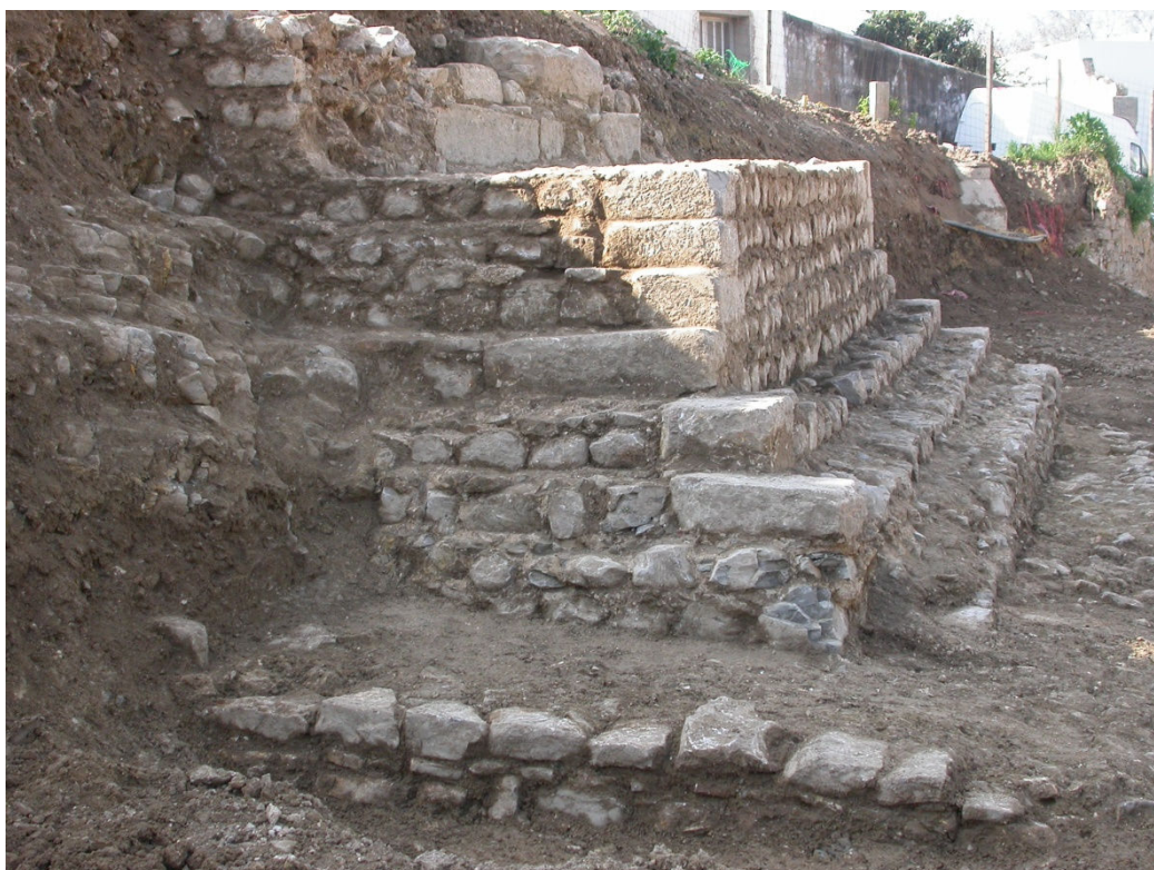
Figura 5 – Torreão da Bela Fria.