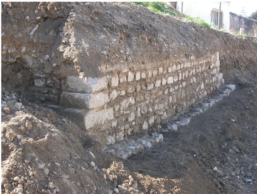
Figura 4 – Aspecto do Torreão aquando da sua escavação.