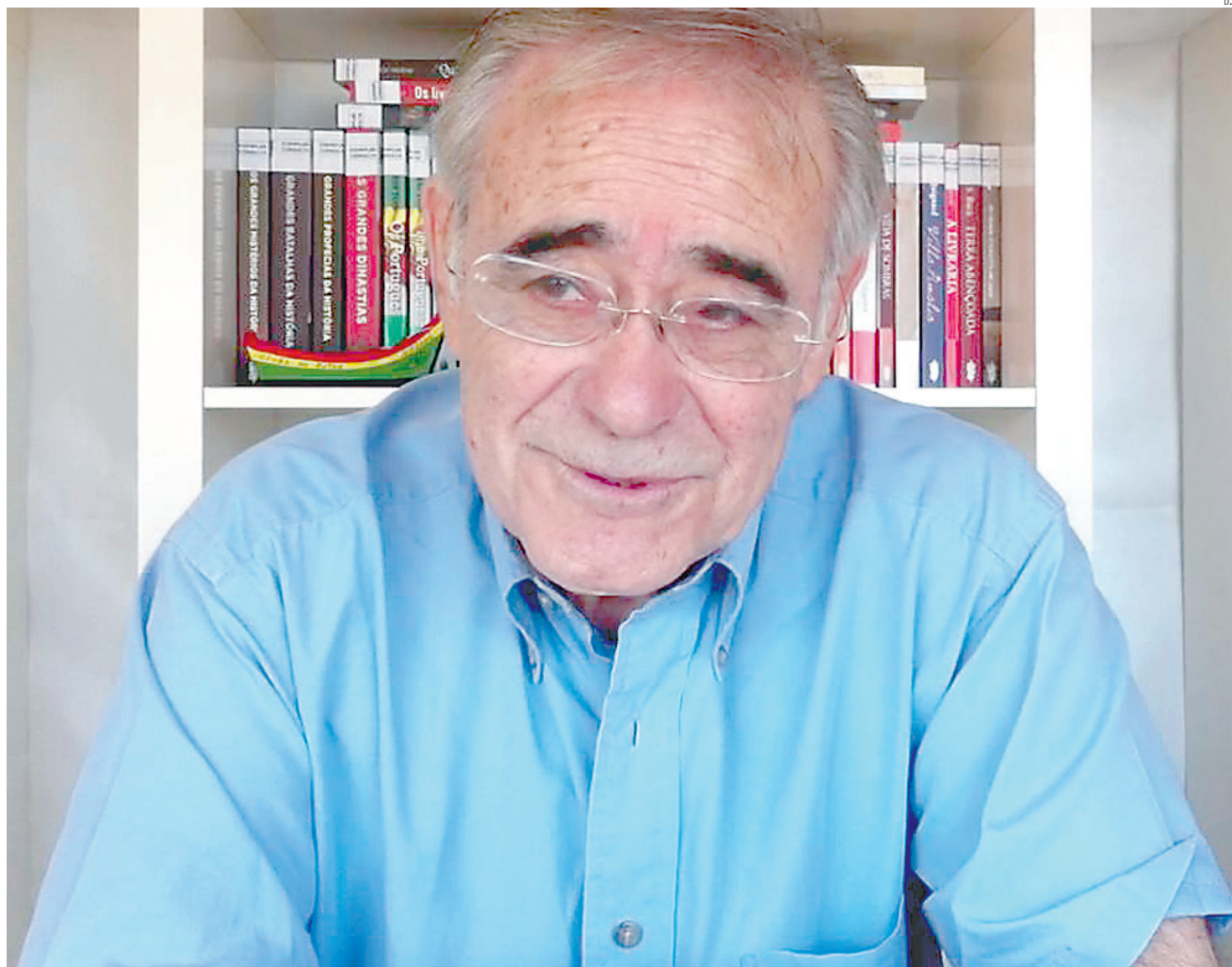
O Diário Oculto de Nora Rute é o novo romance de Mário Zambujal

Em 2012, Mário Zambujal publica, na editora Clube do Autor, Cafuné. Tropelias do secretário da amiga da aia da rainha . Mais uma vez, Zambujal muda de tipo de narrador. Desta vez, está fora da história e conhece tanto o passado como o presente, o que lhe permite fazer conexões entre os dois mundos: “carta (...) mais suculenta que um moderno sms” (p.127); “longe vinha a fresquidão do biquíni e do fio dental” (p.159). Há também aqui, como na