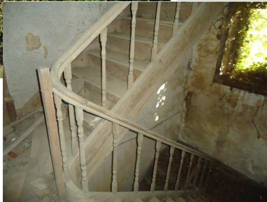
Casa Sapo Moradia T3 Isolada (Fonte Roque)_única foto do interior