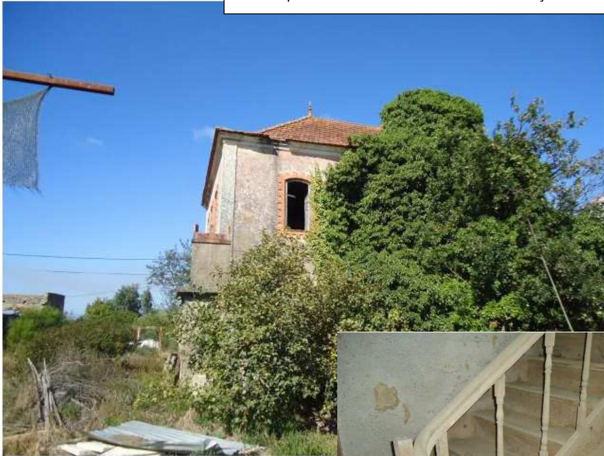
Vista do prédio vizinho no sítio em linha da mediação imobiliária