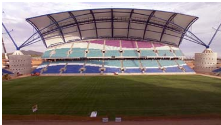
Figura 1: Bancada principal do Estádio Algarve

A elevada flexibilidade da estrutura da Bancada Poente do estádio, apresentando grandes balanços nas consolas e grandes vãos nas vigas, por comparação com arquitecturas com alguma semelhança [1], exigiu que a análise dinâmica possibilitasse a verificação da segurança tendo em conta as vibrações induzidas pelos sismos e pelas pessoas. Em relação à acção do vento, o estudo dinâmico da interacção da cobertura e da bancada requer o recurso a estudos experimentais, em modelo reduzido, em túnel de vento.