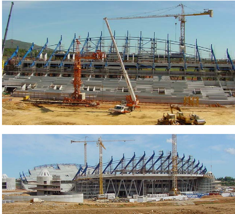
Figura 2: Estrutura das Bancadas (fases de construção)